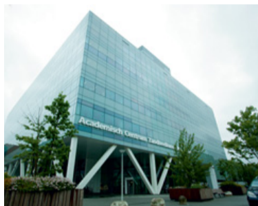
Op ACTA worden ook komend jaar de meeste tandheelkundestudenten toegelaten (144).

De veelbesproken taakherschikking mag voor dit probleem nauwelijks een oplossing heten: hoewel mondhygiënisten het tekort deels kunnen oplossen, zou daarvoor het huidige tekort aan mondhygiënisten alleen maar meer gevoeld worden. Niet voor niets werd in het Kamerdebat gepleit voor een snelle uitbreiding van het aantal opleidingsplaatsen. Op 15 april heeft desondanks het overgrote deel van de aanmelders een afwijzingsbrief ontvangen. ■