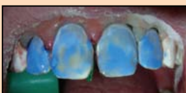
Slika 22. Jetkanje gleđi

Postojanje upalnog procesa i krvarenja desni u oblasti prednje grupe zuba zahtevalo je obavljanje retrakcije desni uz pomoć retrakcionog konca, zatim je izvršeno jetkanje gleđi preparatom Ultra-Etch (Slika 22).