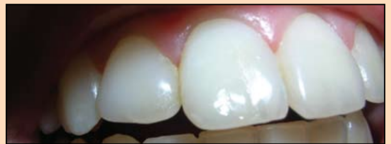
Slika 13. Oštećena gled je pokrivena G-Coat Plus

posle nicanja zuba. Ranije se zbog date anomalije kvar nije lečio. Posle pregleda i ispitivanja postavljena je dijagnoza KOO 29 atipična forma zuba 1.2 (po MKBS-10 KOO 29).