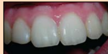
Slika 11. Konačni izgled restauracije posle poliranja