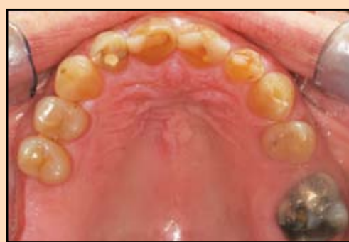
Slika 3. Zubi gornje vilice, sa izraženom abrazijom, velikim ispunima i sekundarnim karijesom

Pripremili smo nekoliko zuba pomoću redukcionih modela koji nam je obezbedila naša laboratorija (PDR), tako da smo preoperativno mogli privremene krunice prebaciti u usta pacijentkinje, a za njihovu izradu koristili smo Luxatemp (Zenith/DMG; Englewood, N.J.). Ovo nam je omogućilo verifikaciju naših ekstraoralnih registara, potvrdu odgovarajuće dužine krunica zuba, merenje rastojanja gledno-cementnih granica gornjih i donjih zuba, odgo-