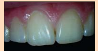
Slika 17. Izgled restauracije posle 3 meseca

Nanet je sloj od bele gline OA2 (korišćen je jednoetapni adhezivni sistem G-Bond od GC), vratna oblast je modelirana sa A2, a za telo i sečivnu ivicu korišćen je A1 (Slika 16). Izgled restauracije posle 3 meseca je prikazan na slici 17.