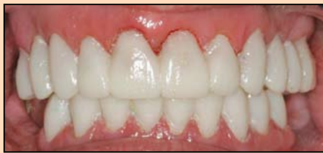
Slika 6. Gotove keramičke krunice na artikulatu, gde se proverava njihovo naleganje, dužina, estetika i okluzija

Registratori zagrižaja su više puta uzimani tokom prepara-