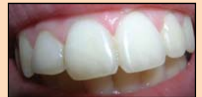
Slika 12. Izgled restauracije posle pretrpljene traume

Posle infiltracione anestezije izvršeno je prepariranje tvrdih tkiva (Slika 15).