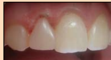
Slika 16. Konačni izgled restauracije

St. Localis: oblik zuba 1.2 je izmenjen. Promena boje nije ispoljena. U zubnom luku nalazi se mala tortoanomalija (Slika 14).