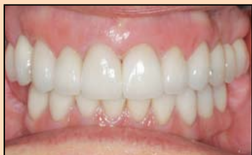
Slika 7. Predivne nove nadoknade vraćaju pacijentkinji osmeh na lice i omogućavaju joj da komforno žvaće po prvi put nakon dugo vremena

nje i donje vilice, kao i odnos preparisanih zuba donje vilice i privremih krunica u gornjoj vilici. Ovo je u znatnoj meri omogućilo bezbedan prenos modela i postupke u laboratoriji i osiguralo očuvanje novouspostavljene vertikalne dimenzije.