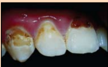
Slika 3. Fluoroza, erozivan oblik, iskomplikovan karijesom

malog značaja ni to što dati kompozitni materijal ima polimerizaciono skupljanje samo 1,7%, dok je skupljanje materijala prethodnih generacija iznosilo 3,5-4% (Mitra SB, et al., 2005). Osim toga, specijalna mrežasta struktura unutar matrice povećava elastičnost, dodaje čvrstoću i postojanost koja štiti od oštećenju. Još jedan važan kvalitet je velika identičnost koeficijenta prelamanja svetlosti sa tkivom zuba. Pošto su čestice manje od dužine talasa vidljive svetlosti ne dolazi do apsorpcije i svetlost prolazi kroz njih kao kroz staklo, što omogućava da se izbegne efekat „vode u čaši“ u toku izvođenja rekonstrukcije (Bašeren M., 2004). Imajući u vidu gore izloženo, klinički aspekti primene datog materijala su ve-