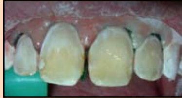
Slika 23. Nanošenje adheziva Single Bond