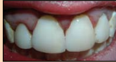
Slika 24. Konačni izgled restauracije

Posle jetkanja nanet je adheziv Single Bond (slika 23) i kru- nični deo zuba je obnovljen ma-