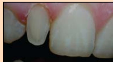
Slika 15. Prepariranje