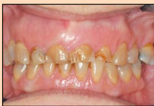
Slika 2. Frakturirani zubi i izražena abrazija otežavaju ishranu i sprečavaju je da se smeje

Ovo je nastalo kao posledica izražene abrazije preostalih zuba (slika 2, 3 i 4). Vrednosti merenja po Shimbashi-ju normalno se kreću u opsegu 16-18mm kod osoba sa okluzijom I klase po Angle-u.