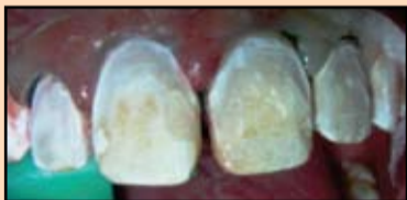
Slika 21. Prepariranje

Postojanje upalnog procesa i krvarenja desni u oblasti prednje grupe zuba zahtevalo je obavljanje retrakcije desni uz pomoć retrakcionog konca, zatim je izvršeno jetkanje gleđi preparatom Ultra-Etch (Slika 22).