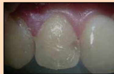
Slika 9. Sloj bele gline OA2, sečivna ivica NT