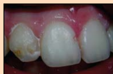
Slika 7. Prepariranje 1. etapa