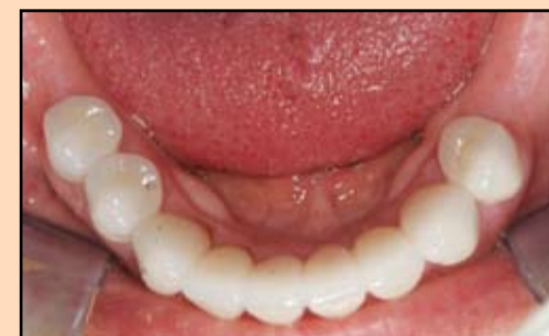
Slika 9. Mandibularne krunice doprinose uspostavljanju vertikalne dimenzije okluzije i celokupnoj estetici i funkciji

definitivno da okončamo restaurativni tretman.