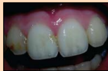
Slika 5. Početna situacija