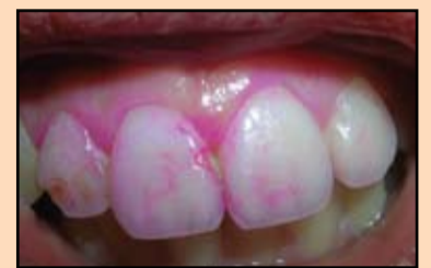
Slika 6. Stanje gleđi posle uklanjanja fiksne proteze