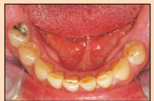
Slika 4. Zubi donje vilice su izgubili vertikalnu dimenziju kao posledica abrazije