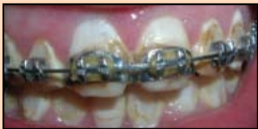
Slika 18. Početna situacija

St. localis: na zube je postavljena fiksna proteza. Otkriven je hronični kataralni gingivitis (Slika 18).