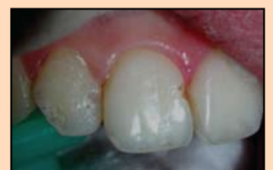
Slika 8. Prepariranje 2. etapa