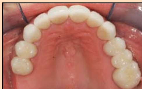
Slika 8. Maksimalne keramičke krunice nadoknađuju frakturirane, karijesne i abradirane zube