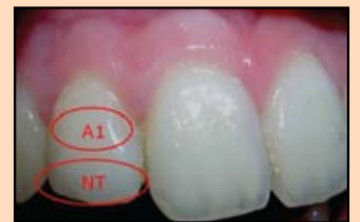
Slika 10. Spoljašnji izgled restauracije