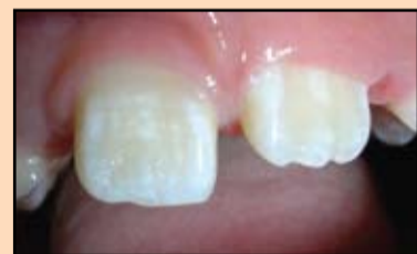
Slika 4. Fluoroza, prošarana forma

Osnovni zadatak te metode je obnavljanje funkcionalne celovitosti zuba, pošto osobine glas-jonomer cementa ne omogućavaju da se izvrši potpuna estetska rekonstrukcija. Po okončanju perioda dinamičkog praćenja vrši se konačna restauracija uz primenu savremenih kompozitnih materijala (Frankenberger R., 2007). U ovom radu koristili smo materijale firme GC Gradia Direct koji spadaju u poslednju generaciju mikrohibrida. Sadržaj punioca je do 87%, isto kao i kod kompozitnih materijala za pakovanje, što obezbeđuje veliku čvrstoću materijala. Nije od-