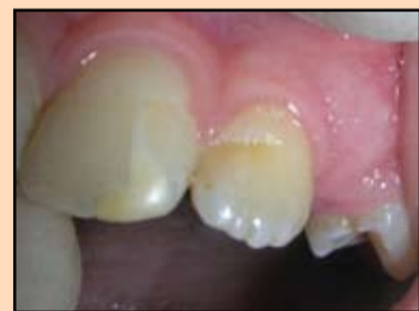
Slika 2. Lokalna hipoplazija gleđi 2.1, 2.2

malog značaja ni to što dati kompozitni materijal ima polimerizaciono skupljanje samo 1,7%, dok je skupljanje materijala prethodnih generacija iznosilo 3,5-4% (Mitra SB, et al., 2005). Osim toga, specijalna mrežasta struktura unutar matrice povećava elastičnost, dodaje čvrstoću i postojanost koja štiti od oštećenju. Još jedan važan kvalitet je velika identičnost koeficijenta prelamanja svetlosti sa tkivom zuba. Pošto su čestice manje od dužine talasa vidljive svetlosti ne dolazi do apsorpcije i svetlost prolazi kroz njih kao kroz staklo, što omogućava da se izbegne efekat „vode u čaši“ u toku izvođenja rekonstrukcije (Bašeren M., 2004). Imajući u vidu gore izloženo, klinički aspekti primene datog materijala su ve-