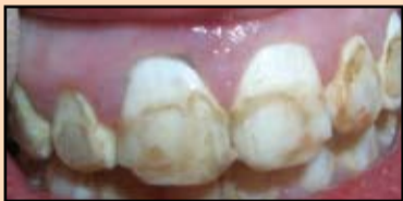
Slika 19. Stanje posle skidanja fiksne proteze

Spoljašnji izgled posle skidanja fiksne proteze prikazan je na slici 19. Treba istaći postojanje viška materijala za plombranje na kontaktnim površinama prednje grupe zuba.