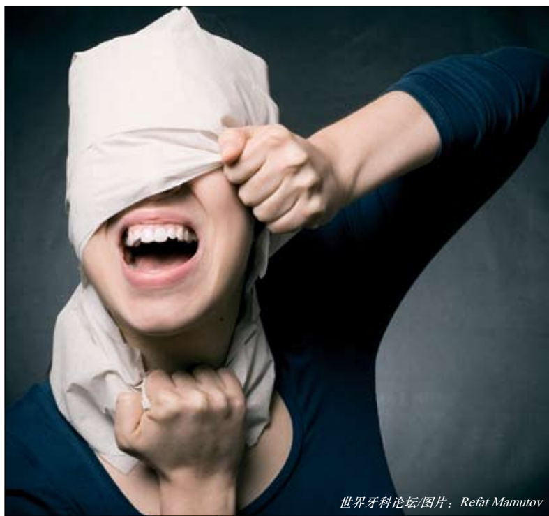
世界牙科论坛

香港/德国莱比锡：来自澳大利亚的一项最新报道称，与正常人群相比，精神疾病患者更容易患口腔疾病。昆士兰大学(UQ)的研究人员在对欧洲、亚洲和美国的20多项研究进行分析后发现，确诊患有严重精神疾病的患者，其发生全口缺齿的风险较正常人高3倍。