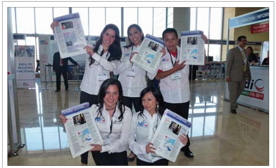
Members of the distribution team of the FDI World Dental Daily, at the FDI World Congress 2011, edited and produced by the Dental Tribune Latin America team in partnership with FDI.

This is particularly relevant since the dental industry in Mexico generate 2.1% of GNP and provides over half a million jobs nationwide. It is estimated that the Congress will bring US $20 million to Mexico. ■