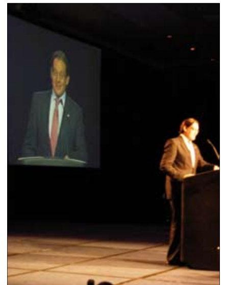
The Health Minister officially opened the event on behalf of the President of Mexico.

El ministro de Salud inauguró oficialmente el evento en nombre del presidente de México.