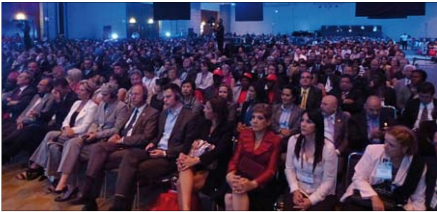
Attendees gathered for the opening of 99th FDI World Dental Congress, which shows the interest of dentist in events of this quality and magnitude.

Imagen del público congregado para la inauguración del 99º Congreso Mundial de FDI, que atestigua el interés de la profesión por eventos de esta calidad y magnitud.