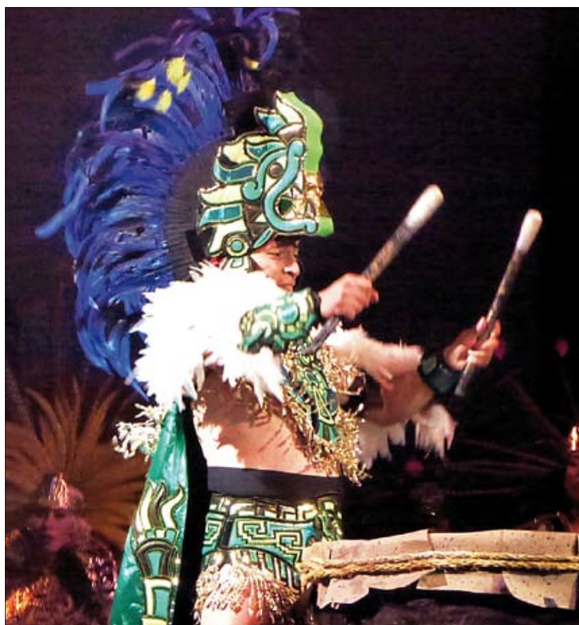
A colorful group of Azteca dancers was part of the opening of the 99th FDI World Dental Congress in Mexico.

"The president's job is to lead, strengthen, and update the policy strategy to address new developments in social, political, economic and technological levels" he said.