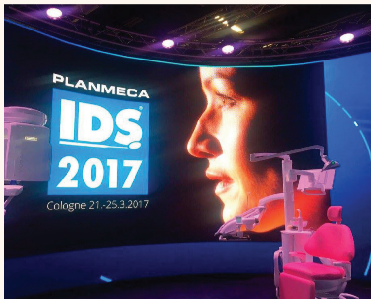
Една от основните атракции на щанда на Planmeca беше презентацията Dream Clinic Show.

Г-н Локки, Planmeca е разработила голям брой нови продукти, които представя за първи път на IDS 2017. Кои от тях са особено значими?