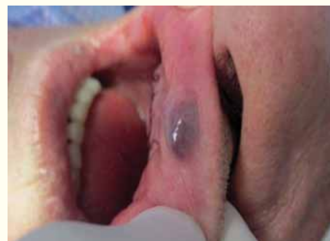
Slike 1-3: Vaskularne lezije usana.