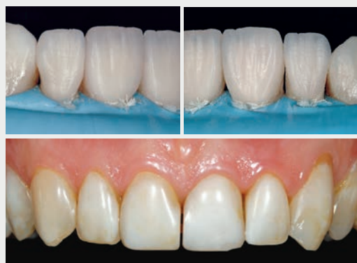
designed by Dr. Didier DIETSCHI

05 SHADING TECHNOLOGY DOUBLE CONSISTENCY SURFACE GLOSS ERGONOMICS