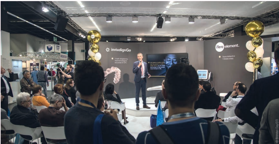
Launch of the Made to Move campaign on Wednesday.