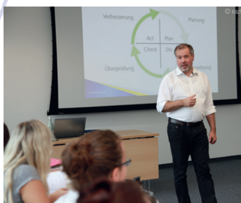
Die Präsenzfortbildung lebt vom persönlichen Kontakt und hat nach wie vor Zukunft.