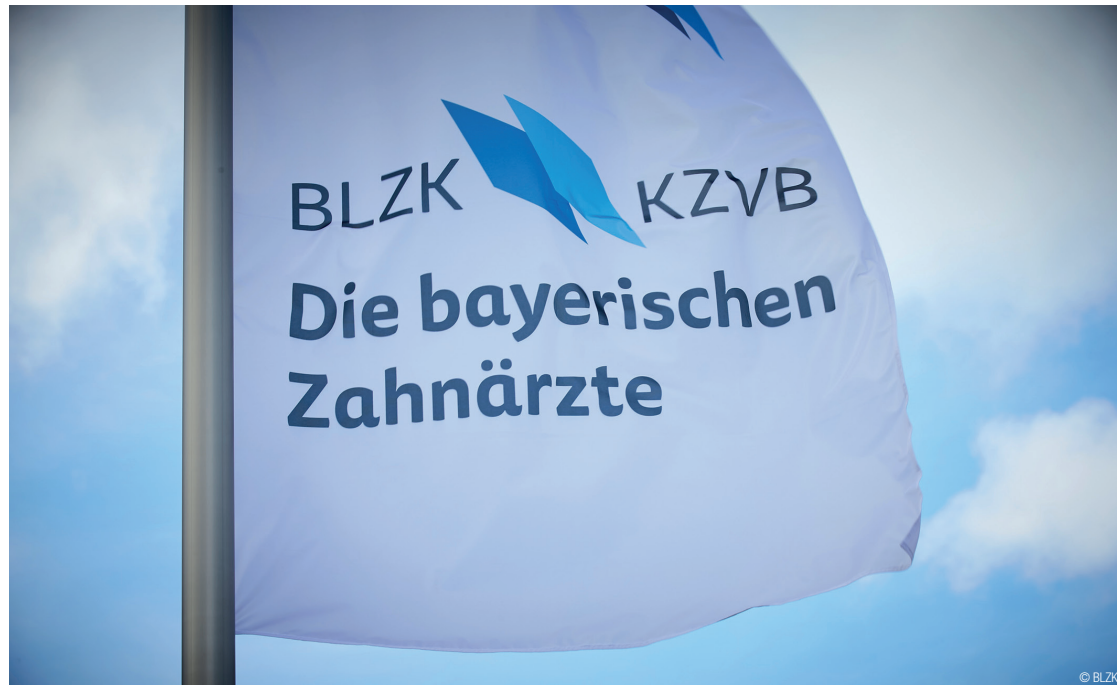
Unter gemeinsamer Flagge beim Bayerischen Zahnärztetag.