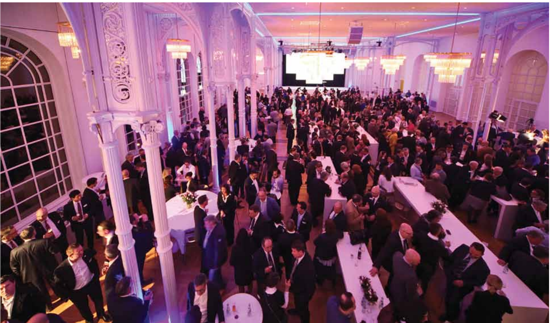
• 750 Gäste nahmen an KaVo Kerr Groups "Art of Innovation"-Event am Dienstagabend teil. • 750 guests attended the KaVo Kerr Group's Art of Innovation event Tuesday evening.