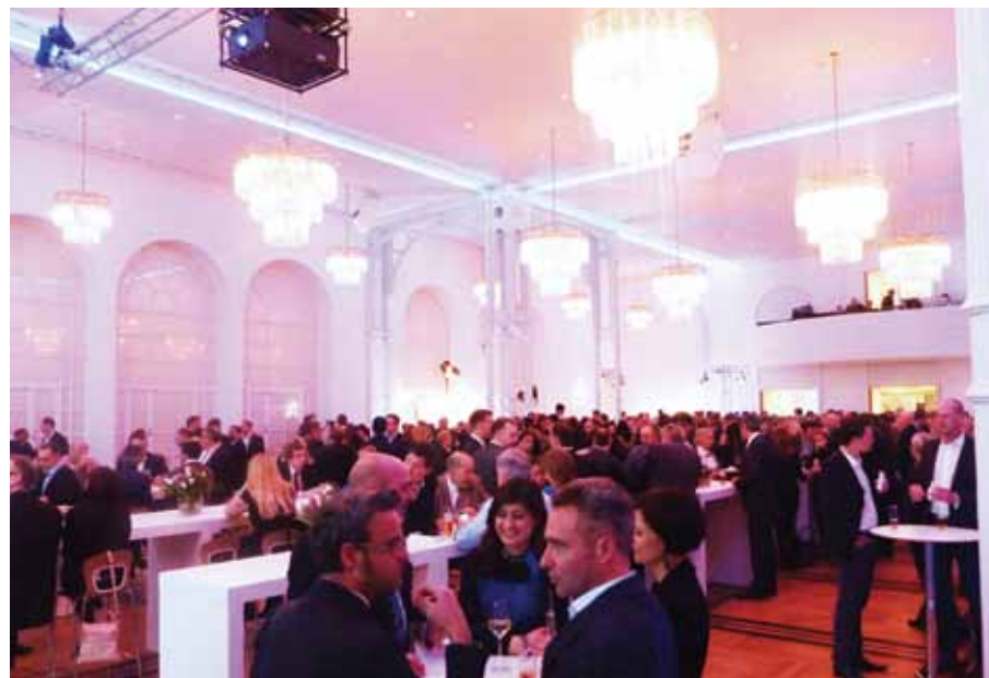
· Etwa 750 Gäste nahmen an KaVo Kerr Groups "Art of Innovation"-Event teil. · About 750 guests attended the KaVo Kerr Group's Art of Innovation event.