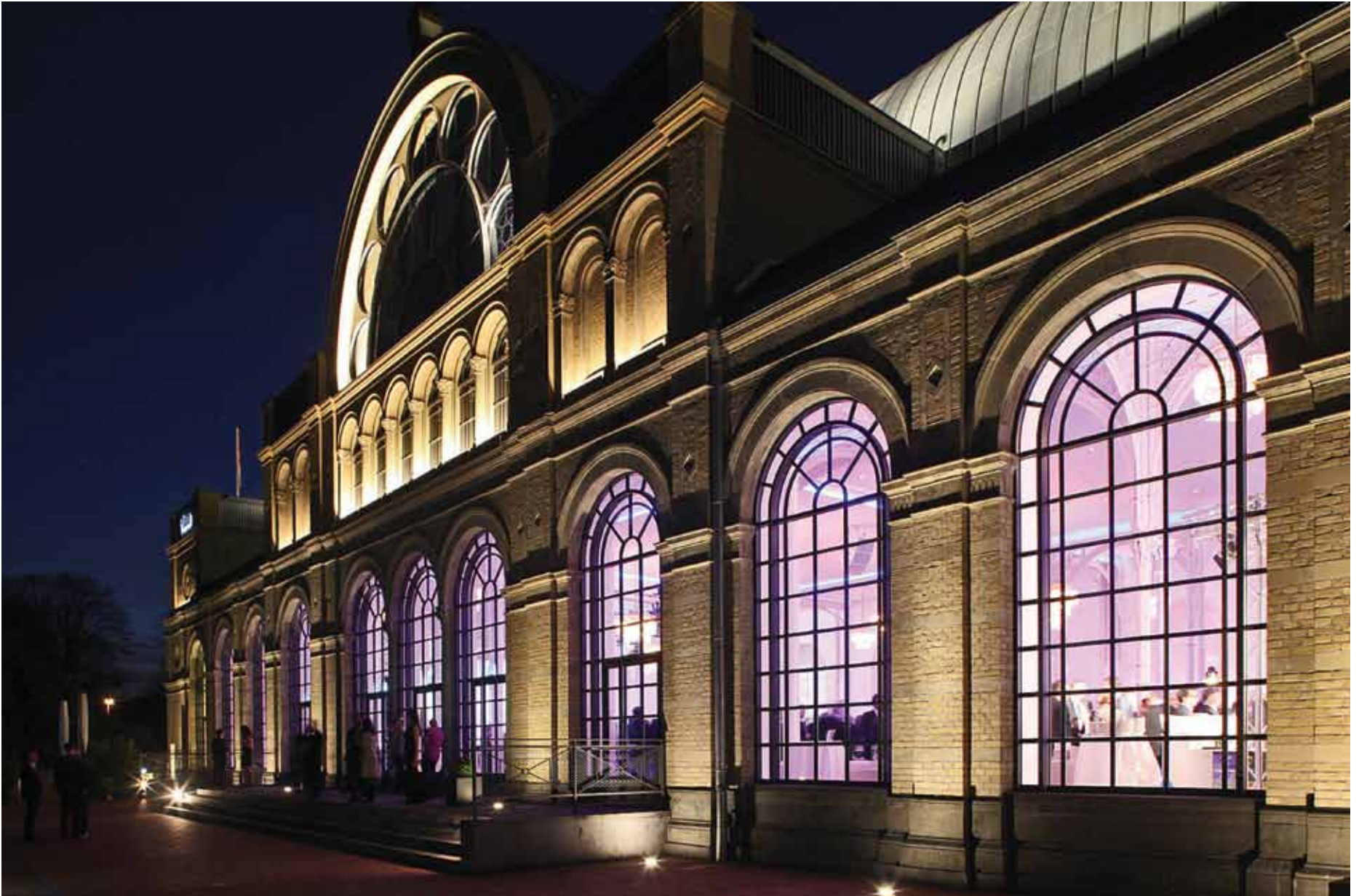
Flora Köln