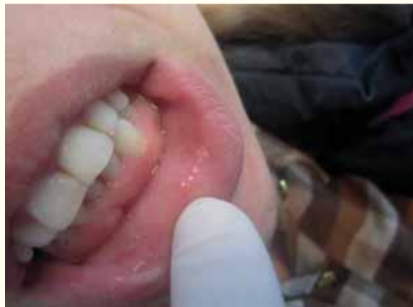
Slike 6-7: Četiri sedmice nakon tretmana diodnim laserom od 980 nm. Proces zacjeljivanja rana je završen bez formiranja ožiljaka

U ovom istraživanju su upoređeni rezultati dvije različite grupe dobiveni na osnovu istraživačkog protokola. Prvu grupu je činilo 30 pacijenata sa različitim vaskularnim lezijama koje su tretirane diodnim laserom (Sirona Dental Lasers) od 980 nm. Druga grupa je bila kontrolna grupa u kojoj su pacijenti tretirani konvencionalnim tehnikama uz pomoć hirurških skalpela. Rezultati su evaluirani kao rani i dugoročni rezultati. Pacijenti laserske grupe su podvrgnuti samo jednom tretmanu. U ovom istraživanju je uključen i slučaj vaskularne lezije donje usne u kojem su različiti dijelovi tretirani u 5 tretmana.