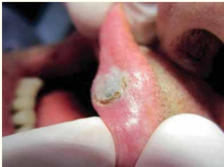
Slika 5: Neposredno nakon tretmana

razliku od tretmana hirurških skalpelima je minimalno invazivan i omogućava dobre estetske rezultate. U poređenju sa pacijentima koji su tretirani konvencionalnim metodama, pacijenti tretirani laserom su se osjećali lagodnije po pitanju tretmana kao i u post-hirurškoj fazi jer im se nisu javljali ni bol ni otekline. Pacijenti koji su bili pod antikoagulantnom terapijom su tretirani bez zamjena prije laserskog zahvata. Tokom tretmana nije se javilo krvarenje kod pacijenata ove grupe. Primjena lasera je izvršena u relativno kratkom tretmanu i jednako je dobro prihvaćena od strane svih pacijenata bez obzira na njihovu starosnu dob. Nakon primjene lasera rane su zacijelile u kratkom vremenskom periodu te se nije javilo formiranje ožiljaka kao ni funkcionalne smetnje. ■