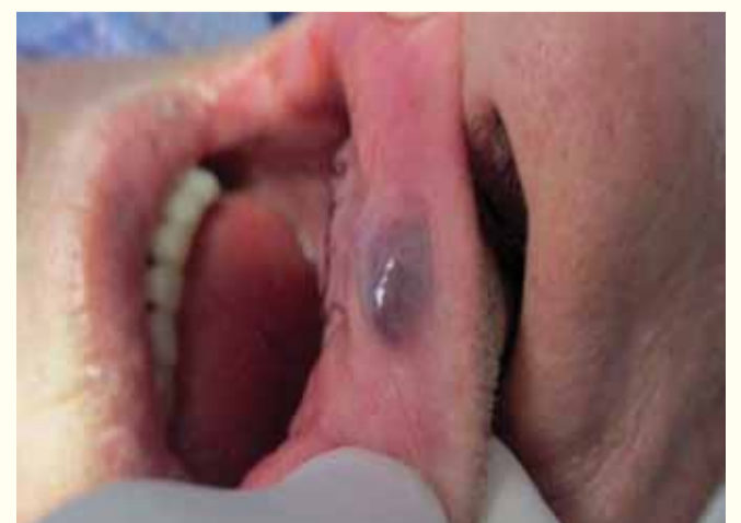
Slike 1-3: Vaskularne lezije usana.