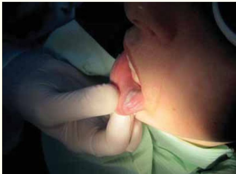
Slika 4: Tretirano područje nije krvarilo a završena je i intralezijska fotokoagulacija

mjesec dana nakon tretmana, šest mjeseci, jednu godinu i tri godine nakon tretmana kako bi se procijenile karakteristike zacjeljivanja rane u ranim fazama kao i dugoročni rezultati. Sve faze tretmana kao i vremenski periodi praćenja pacijenata su dokumentovani fotografijama koje su poslužile za poređenje u dugoročnoj evaluaciji.