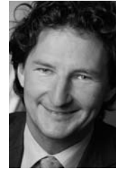
Univ.-Prof. Dr. Dr. Raoul Polansky

Für den chirurgischen Part sind digitale Methoden im Moment wenig sinnbringend, jedoch ist es für die Anfertigung der prothetischen Suprastruktur durchaus sinnvoll, CAD/CAM-gefertigte Gerüste zum Einsatz zu bringen.