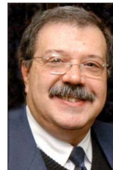
Prof. Reinaldo Brito e Dias

Reinaldo Brito e Dias vai ministrar um curso com o tema “O papel dos protetores bucais na integridade física dos atletas” durante o 34º CIOSP no dia 28, das 16h30 às 18h30, e diz que as pessoas só têm ideia da dimensão do problema quando perdem um dente. “Até surgir o problema, a pessoa fala ou morde uma maçã automaticamente. Mas, por exemplo, imagina o que é fazer isso sem um dente da frente? Toda saúde do atleta fica comprometida. Ele sofrerá res-