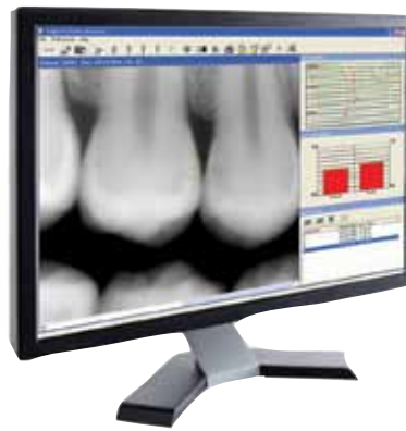
• Logiciel Logicon Caries Detector • Logicon Caries Detector Software