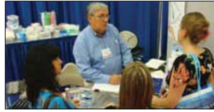
· Des participants, plaçant une commande chez Prodont Holliger (kiosque No. 2114A). · Meeting attendees place an order at Prodont Holliger (booth No. 2114A).