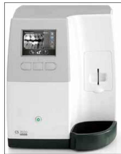
• Le système de radiographie numérique intra-orale CS7600. • The CS 7600 digital intraoral radiography system.

liquid-lens autofocus technology as Carestream Dental's 1500 Intraoral Camera.