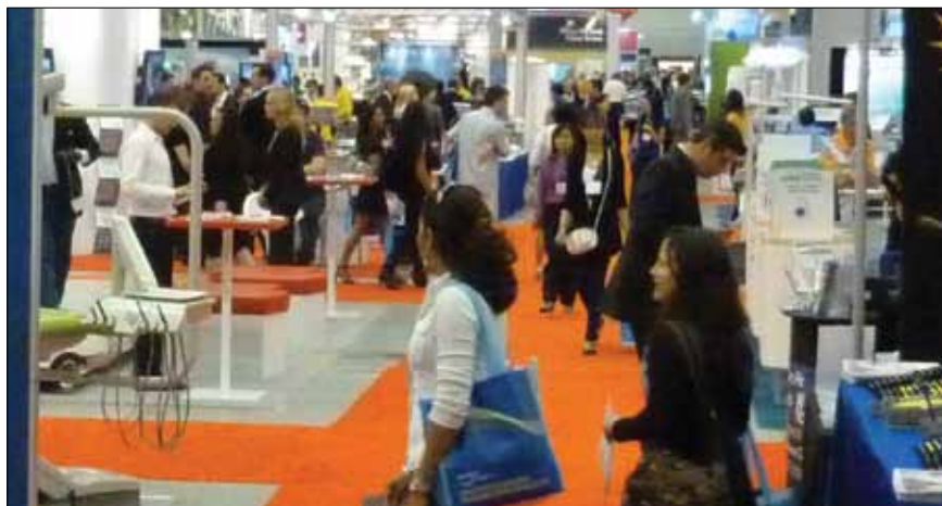
• Le plancher d'exposition lundi matin. (Photo/Robert Selleck, Dental Tribune) • The exhibit hall floor on Monday morning. (Photo/Robert Selleck, Dental Tribune)