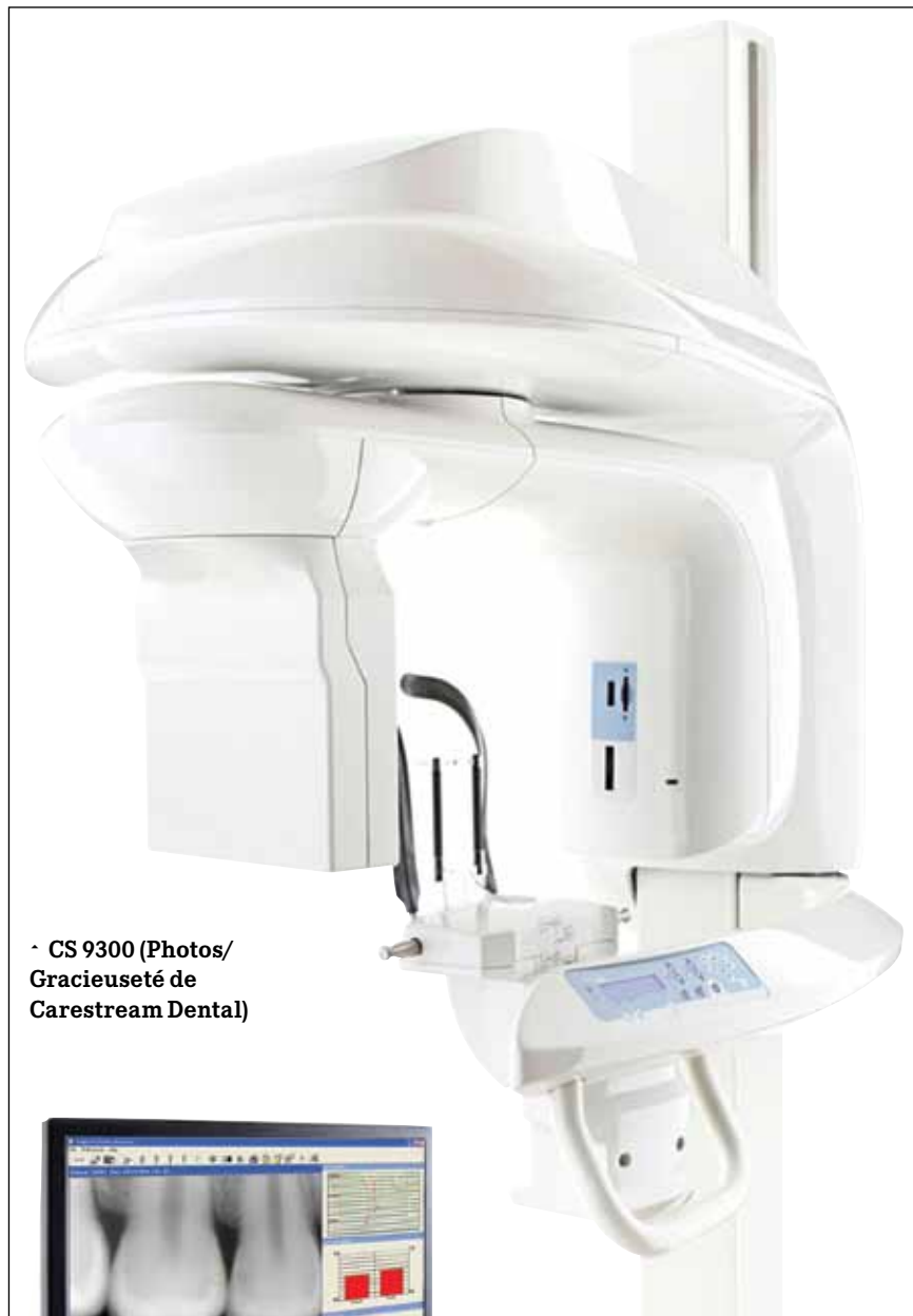
• CS 9300

• The CS 1600 is a multi-use intraoral camera combining exclusive caries detection technology with Carestream Dental's industry-leading image quality. With the widest focus range on the market (1 mm to infinity), this camera has the same unique