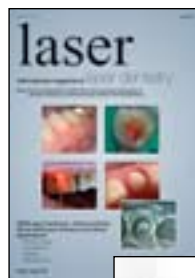
激光: SIROLaser 概况的详细信息。

有关牙科医生和“SIROLaser 概况-关于 SIROLaser 进展和 Xtend 应用的临床研究”的更多信息可登录 www.sirona.de 并可免费下载。