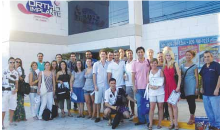
• L'équipe du Q-Implant Marathon avec des participants à Santo Domingo. • The Q-Implant Marathon team with participants in Santo Domingo.