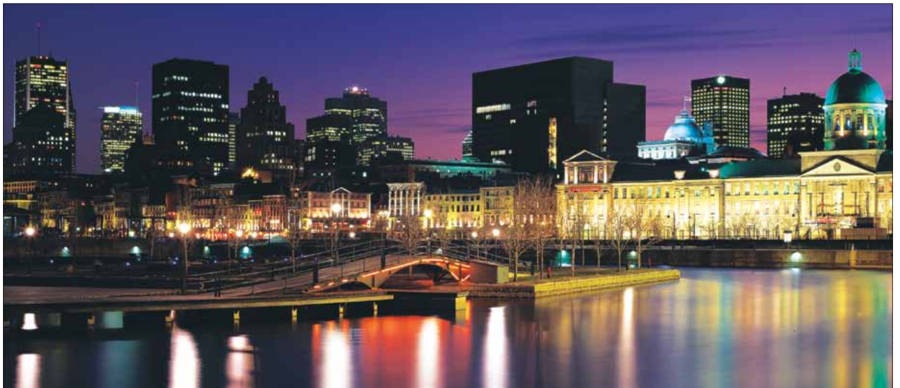
• Les quais du Vieux-Port de Montréal et la silhouette de Montréal servent de toile de fond pour vous mettre au goût des Journées Dentaires Internationales du Québec (JDIQ). (Photo/Provided by Tourisme Montréal, Stéphan Poulin) • Quays of the Old Port of Montréal and Montréal skyline serve as an enticing backdrop to the journées dentaires internationales du Québec (JDIQ). (Photo/Provided by Tourisme Montréal, Stéphan Poulin)