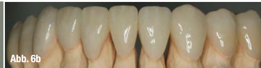
Abb. 6a-b _ Fertiggestellter Zahnersatz.