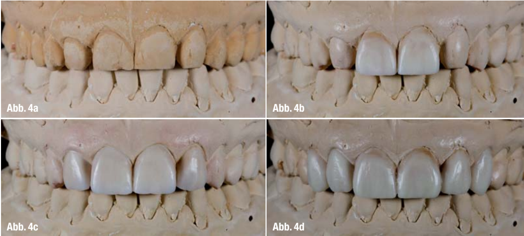
Abb. 4a-d_ Situationsmodell (4a) und Anfertigung des Wax-ups.

Versorgung angefertigt (Abb. 6). Des Weiteren bestand der Wunsch, eine kleine Zahnfleischkorrektur an Zahn 13 durchzuführen, um den Längenunterschied zu 23 etwas auszugleichen. Die Tiefe des äußeren Saumepithels betrug etwa 2 mm und konnte