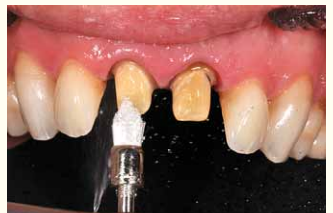
Slika 3: Čišćenje polir četkicama uz vodeni mlaz.