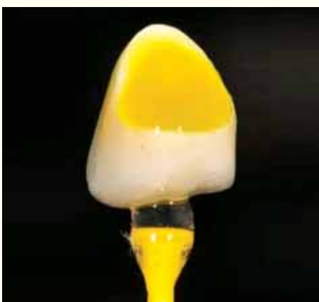
Slika 4: Jetkanje unutrašnjosti e.Max krunica hidrofluornom kiselinom (5%) te ispiranje vodenim/zračnim mlazom. Za uspješno cementiranje nakon jetkanja treba izbjegavati svako onečišćenje površine.