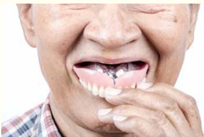
Prema rezultatima najnovijih istraživanja utvrđeno je da se stariji pacijenti trebaju savjetovati da uklone zubne proteze prije spavanja

Istraživanje su sproveli istraživači sa Stomatološke škole Nihon univerziteta i Škole medicine Keio univerziteta u Tokiju. ■