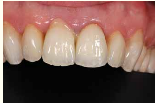
Slika 9: Cementiranje druge krunice na zubu 11.