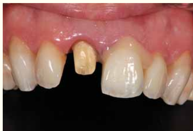
Slika 6: Cementiranje krunice na zubu 21.

samoadhezivnim kompozitnim cementima. Pri cementiranju krunica na bazi cirkonij-oksidge keramike glavna je briga osigurati dobru retenciju. Spajanje s cirkonij-oksidge keramikom danas je pravi izazov. Uz specifične fosfatne monomere, G-CEM LinkAce čini se da pruža stabilnu vezu s cirkonij-oksidge keramikom bez potrebe za dodatnim primerima (2).