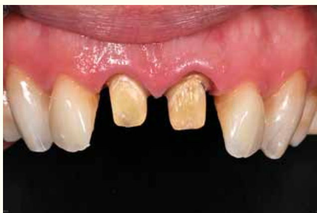
Slika 2: Preparacije na zubima 11 i 21 nakon odstranjenja privremenih radova.