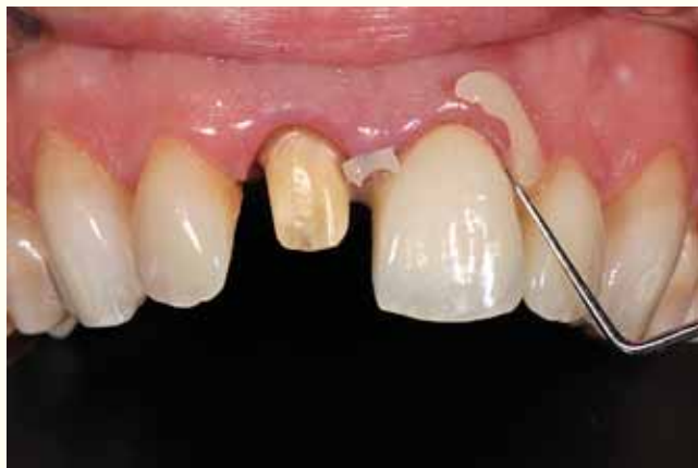
Slika 8: Odstranjenje viška sondom. Odstranjenje viška u aproksimalnom području može se izvršiti pomoću zubnog konca. Treba stalno paziti da se izbjegne pomicanje krunice u toj ranoj fazi.