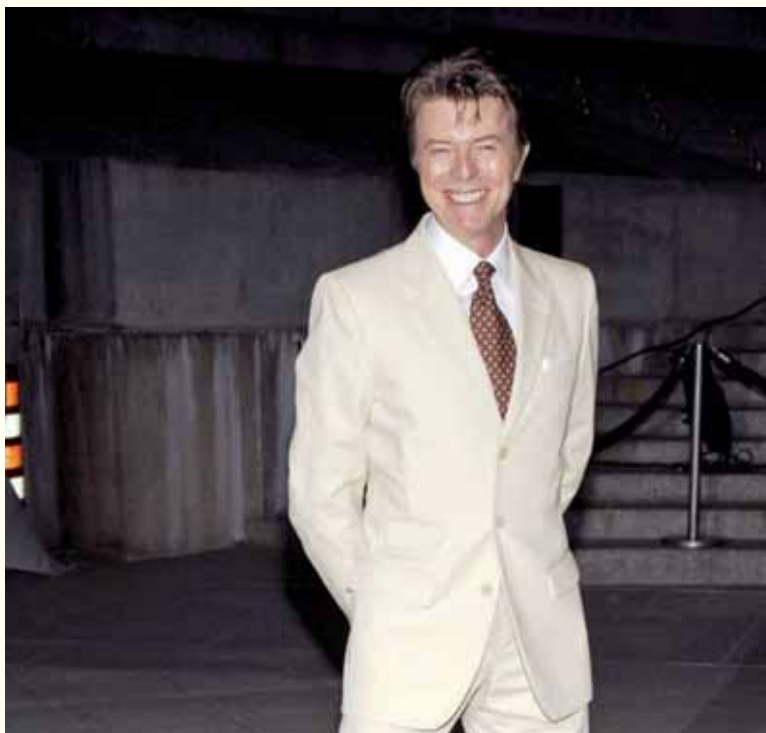
Slika Davida Bowiea iz 2007. godine koja pokazuje njegov novi osmijeh

„...ideja za skulpturu rodila se iz nostalgичne čežnje za Bowievim starim zubima.“