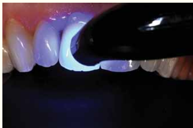
Slika 10: Završna polimerizacija 40 sekundi po svakoj strani (na slici je vestibularna) uređajem za svjetlosnu polimerizaciju u načinu rada visokim intenzitetom.