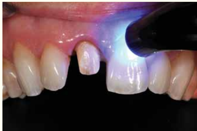
Slika 7: Stvrđnjavanje u mjestu polimerizacijskim svjetlom 1 sekundu prije odstranjenja viška. Alternativno se može čekati 1 ili 2 minute dok cement ne postane gumast.