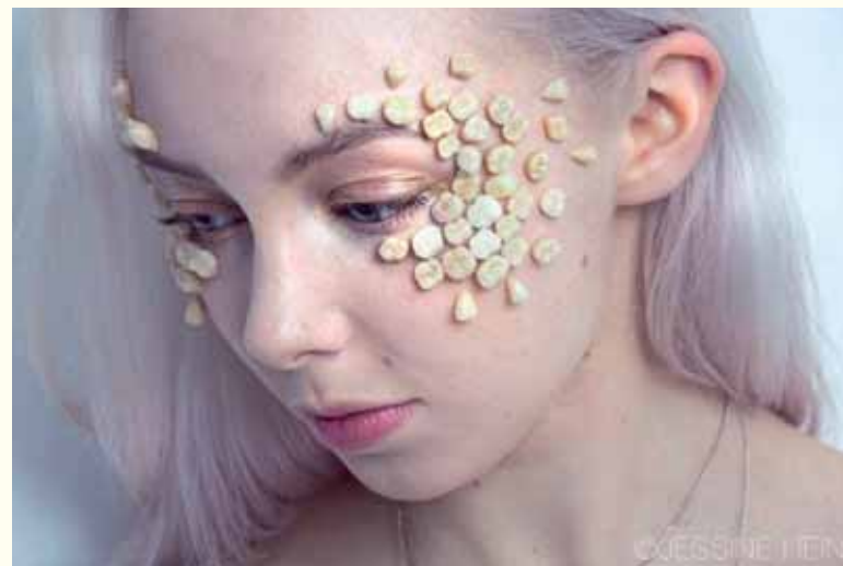
Umjetnica lično nosi masku sa zubima

zahvaljujući upravo tom hollywoodskom osmijehu koji je igrao važnu ulogu od prirodnog izgleda zuba pa čak iako je bila potrebna medicinska intervencija. Ne mogu zamisliti da je osoba poput Davida Bowiea svojevrijedno dozvolila nekom da mijenja enterijer njegovih usta, tako da ja njegove bijele bisere interpretiram kao jasnu izjavu koja je otvorila novo poglavlje u njegovoj karijeri, možda, kao odgovor na sveprisutnu društvenu opsjednutost ljepotom: „Želite propisane standarde ljepote? E pa evo ih!“. Ova transformacija je bila dio njegovog prerastanja iz izvanzemaljskog osvajača srca u svjetsku zvijezdu. Moja skulptura ima cilj istaći upravo ovo što sam vam rekla, kao i odati počast eri čuda s krivim zubima koje je, prije mnogo vremena, došlo na Zemlju.