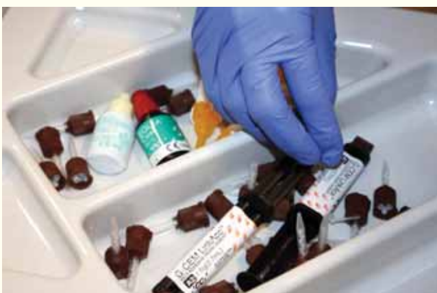
Slika 1: G-CEM LinkAce šprice ne treba čuvati u hladnjaku.

„G-CEM LinkAce držim u ladici, uvijek spremnog za upotrebu.“