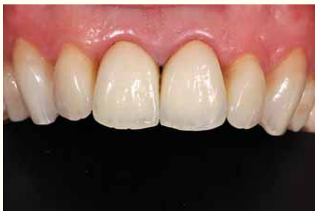
Slika 11: Završni rezultat odmah nakon cementiranja.