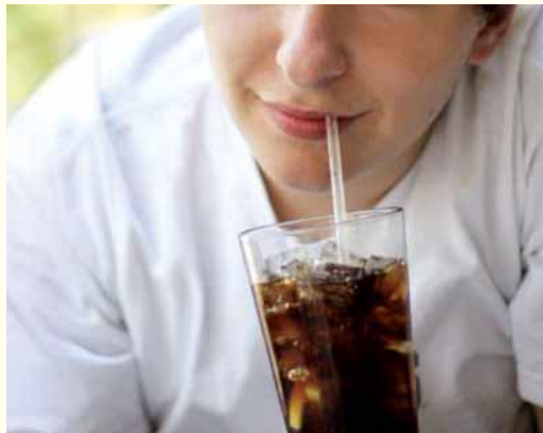
Njegova ovisnost o zaslađenim pićima dovela je do toga da je mladi Australijanac ostao bez svojih zuba.

najmanje jedno zaslađeno bezalkoholno piće dnevno. Posljedično tome, zdravstveni stručnjaci pozivaju na upozoravanje od nastanka zubnog karijesa usljed konzumiranja zaslađenih pića. ■