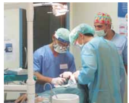
• Participants du Q-Implant Marathon travaillant en équipe à Santo Domingo. • Q-Implant Marathon participants in Santo Domingo working in a team.

ing the surgery, questions about surgical treatments are addressed.