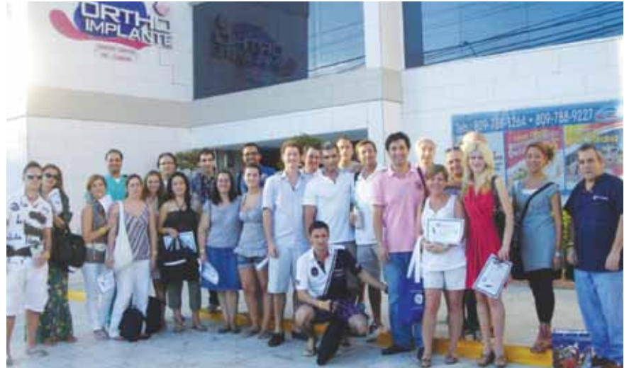
• L'équipe du Q-Implant Marathon avec des participants à Santo Domingo. • The Q-Implant Marathon team with participants in Santo Domingo.