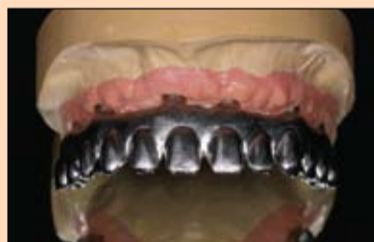
Slika 6. do 8. Kako bi se bolje proverilo naleganje suprastrukture, najbolje je raditi s gingivnom maskom koja se može skidati. Naleganje je bilo izvrsno, što je potvrđeno Sheffieldovim testom.