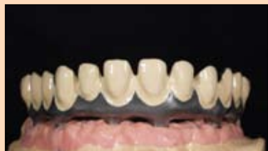
Slika 16. Nakon drugog sloja opakera može se započeti slojevito nanošenje kompozita.