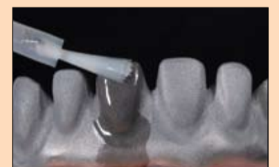
Slika 20. Kako bi se osigurala hemijska veza između titanske konstrukcije i kompozita, nanesen je posrednik veze.

njati izduvavanjem ili pod mlazom vodene pare. Na tako pripremljenu osnovnu konstrukciju kao posrednik veze između metala i kompozita tanko se jednokratnom četkicom apliciran SR Link.