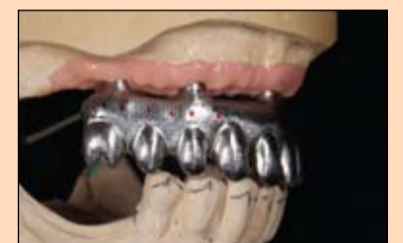
Slika 19. Kako bi se osigurala hemijska veza između titanske konstrukcije i kompozita, nanesen je posrednik veze.