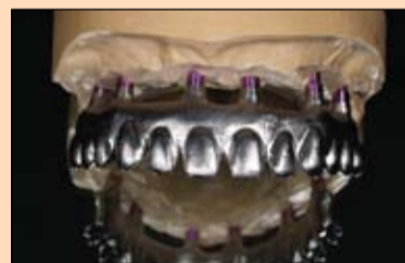
Slika 15. Kako bi se osigurala hemijska veza između titanske konstrukcije i kompozita, nanesen je posrednik veze.