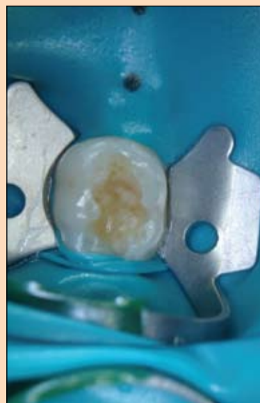
Slika 1 i 2: Slučaj predstavlja karioznu leziju na zubu 85 kod osmogodišnje devojčice. Nakon lokalnog anesteziiranja područja zuba i određivanja boje postavlja se koferdam te ekskavira kariozna lezija.