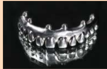
Slika 14. Kako bi se osigurala hemijska veza između titanske konstrukcije i kompozita, nanesen je posrednik veze.