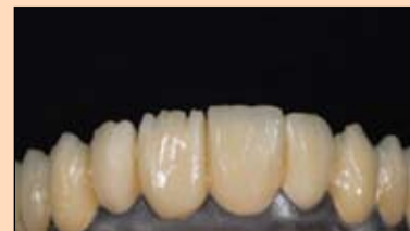
Slika 19. Individualizacija se provodi Stains materijalima.

jer se zbog mikrohrapavosti povećava retencijska površina, SR Link promovise hemijsku vezu. Pritom je važno celu metalnu površinu premazati posrednikom veze i ostaviti da deluje dovoljno dugo – oko tri minute (slike 13. i 14.).