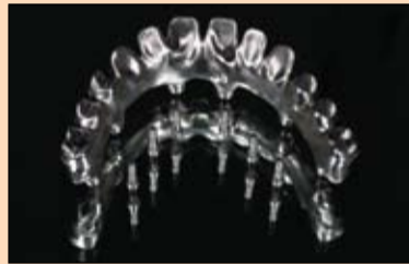
Slika 4. i 5. Izrađen je nacrt mosta nošenog implantatima od titana koji je izrađen u centru za glodanje Nobel Biocare.