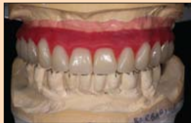
Slika 2. i 3. Probnom postavom definisan je protetski cilj.

Kako bi se oblikom osnovne konstrukcije sprečio nastanak pukotina i odlamanje fasetnog materijala, prelazi su zaobljeni. Planirano je da bazalni