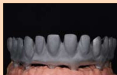
Slika 17. Kako bi se osigurala hemijska veza između titanske konstrukcije i kompozita, nanesen je posrednik veze.

Estetski važan factor je marginalna gingiva koja kod prirodnih zuba teče na nivou gledno-dentinskog spoja i posebno u interdentalnim prostorima naglašava trodimenzionalnost pojedinog zuba. Zato je ta prelazna zona između zubnih vratova i mekog tkiva pomoću napete gumice ozna-