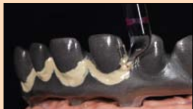
Slika 15. Opaker boje zuba najpre se nanese na cervikalna područja. Na taj način stvara se čist prelaz.