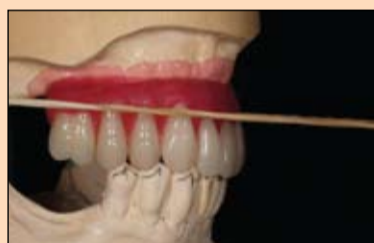
Slika 9. Nategnutom gumicom u artikulatu su označene najdublje tačke zuba...