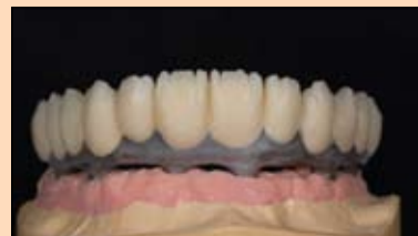
Slika 18. ...zatim se primenom cut-back tehnike ciljanim reduciranjem priprema za individualizaciju i modelovanje incizalnog dela.