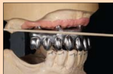
Slika 16. Kako bi se osigurala hemijska veza između titanske konstrukcije i kompozita, nanesen je posrednik veze.