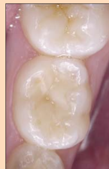
Slika 6-1 i 6-2: Ispun na zubu 85 nakon tri sedmice. Posle ovog ispuna pacijent je nastavio sa tretmanima ispunima i zalivanjem fisura.