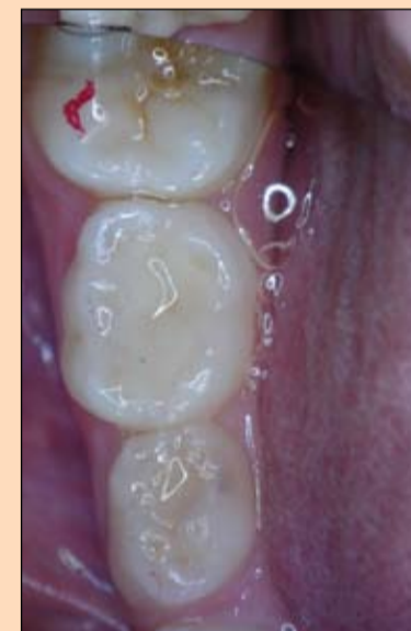
Slika 5-1 i 5-2: Nakon odstranjivanja koferdama kontroliše se okluzija. Konačno, ispun se polira i zub fluoridira.