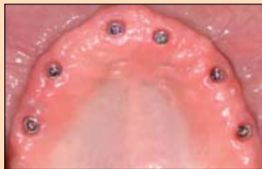
Slika 1. U gornjoj vilici usađeno je šest implantata u protetski optimalnom položaju.

U gornju bezubu vilicu pacijenta usađeno je šest implantata u optimalnom protetskom položaju (slika 1.). Na taj način osiguran je savršen oslonac za planiranu implantoprotetsku nadoknadu. Pacijent se odlučio za most pričvršćen šrafovimama s titanskom konstrukcijom obloženom kompozitom. Estetika i dimenzije izgubljenih tkiva individualno su rekonstruisane pomoću wax upa, odnosno