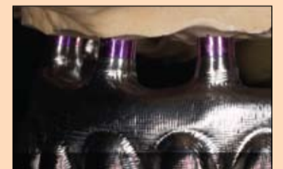
Slika 18. Kako bi se osigurala hemijska veza između titanske konstrukcije i kompozita, nanesen je posrednik veze.

Gotova obrađena osnovna konstrukcija peskirana je aluminijum oksidom (50-110 µm) pod pritiskom od 2 do 3 bara. Eventualni ostaci Al 2 O 3 mogu se lako otresti te se ne smeju ukla-