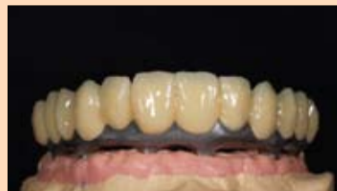
Slika 17. Telo zuba izgrađuje se od dentinskog materijala u punoj anatomiji...