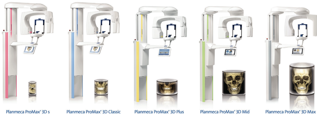
Planmeca ProMax® 3D s

Производител: Planmeca, Финландия, от „ДеМаКом“, зала 2, щанд D1, „Булдентал“