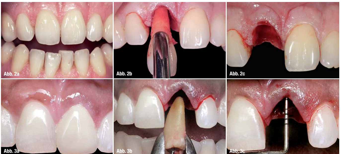
Abb. 2a-c _ Visuelle Bestimmung des gingivalen Biotyps vor und nach der Extraktion von Zahn 11. Abb. 3a-c _ Visuelle Bestimmung des gingivalen Biotyps unter Zuhilfenahme einer Parodontalsonde vor und nach der Extraktion von Zahn 21.

Mit dem Begriff gingivaler Biotyp wird die Dicke, Struktur und das Aussehen der Gingiva bezeichnet. Als Synonyme werden die Begriffe parodontaler Biotyp, gingivaler Phänotyp oder gingivaler Morphotyp verwendet. Die Vielzahl der in der Literatur verwendeten Synonyme zeigt, dass eine einheitliche, standardisierte Nomenklatur fehlt. Gleichwohl geht man davon aus, dass der Gewebebiotyp einer der wichtigsten prognostischen Faktoren für die Vorhersagbarkeit eines plastisch-ästhetischen pa-