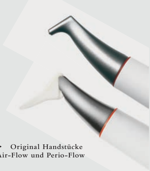
> Original Handstücke Air-Flow und Perio-Flow

Und wenn es um das klassische supragingivale Air-Polishing geht,