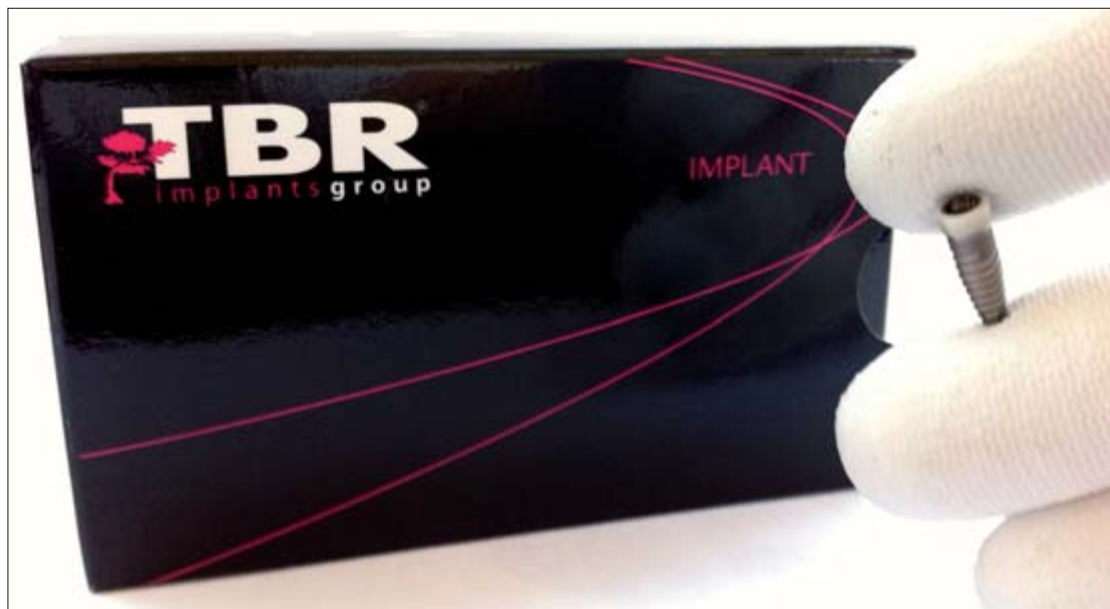
◀ PERIOSAVE Implantat mit Kragen aus Zirkon. ▶ PERIOSAVE implant with an anti-bacterial zirconia collar.