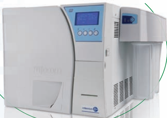
Millennium with Mocopure 100