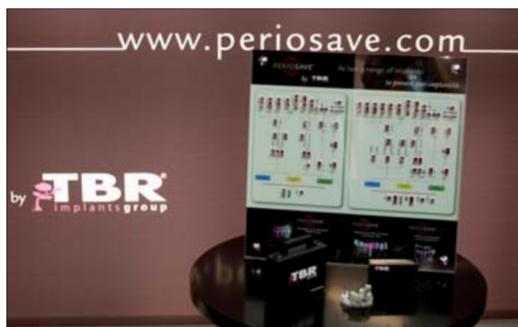
PERIOSAVE Implantatproduktlinien. * PERIOSAVE implant product line.

Ein neuer Schutzschild gegen Periimplantitis A new shield against peri-implantitis