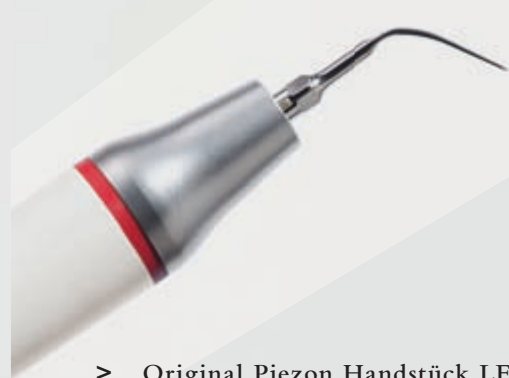
> Original Piezon Handstück LED mit EMS Swiss Instrument PS

Praktisch keine Schmerzen für den Patienten und maximale Schonung des oralen Epitheliums – grösster Patientenkomfort ist das überzeugende Plus der Original Methode Piezon, neuester Stand. Zudem punktet sie mit einzigartig glatten Zahnoberflächen. Alles zusammen ist das Ergebnis von linearen, parallel zum Zahn verlaufenden Schwingungen der Original EMS Swiss Instruments in harmonischer Abstimmung mit dem neuen Original Piezon Handstück LED. Sprichwörtliche