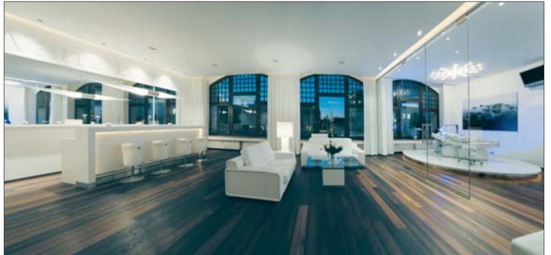
White Lounge Leipzig, www.white-lounge.com

Bleaching ist eines der häufigsten gewünschten Verfahren. Mit dem BriteSmile-System zum Beispiel bieten wir eine besonders schonende Form des Bleachings an. Dank der LED Kaltlichttechnologie der BriteSmile-Speziellampe in optimaler Abstimmung