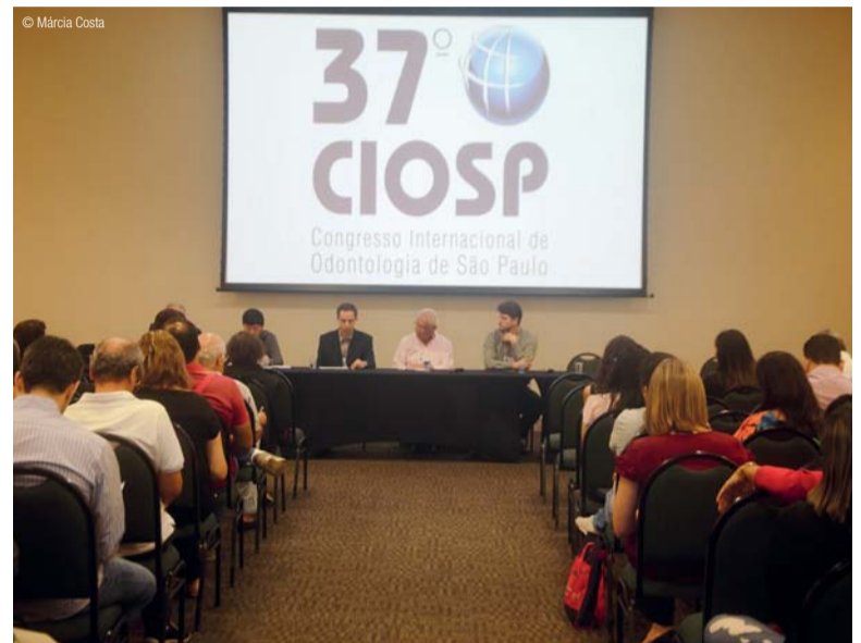
* Projeto Saúde Coletiva discute, tradicionalmente, o acesso democrático à saúde.