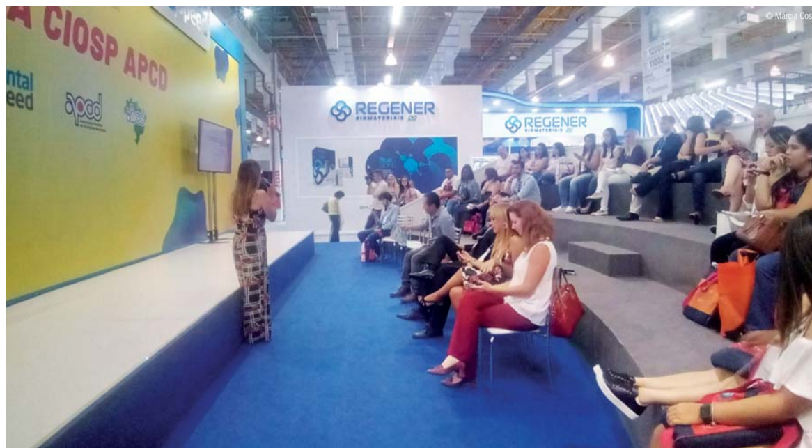
• Uma conversa sobre a relação entre estética e ética na conduta odontológica.

As atividades da Arena buscam complementar a programação científica do CIOSP, debatendo temas relativos ao