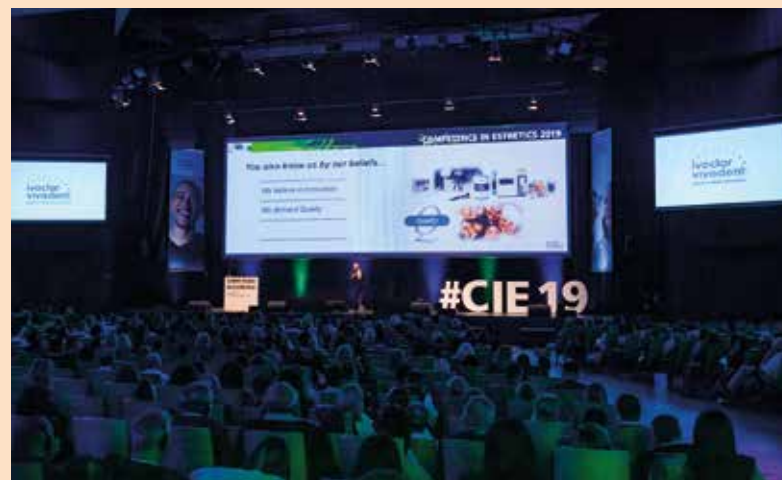
Sl. 3.: Simpozijum Competence in Esthetics, vrhunski događaj za doktore dentalne medicine i dentalne tehničare u regiji

su rada. Pokazalo se da je uska saradnja između doktora dentalne medicine i dentalnog tehničara ključ uspeha u svim slučajevima. Ostale teme o kojima se razgovaralo bile