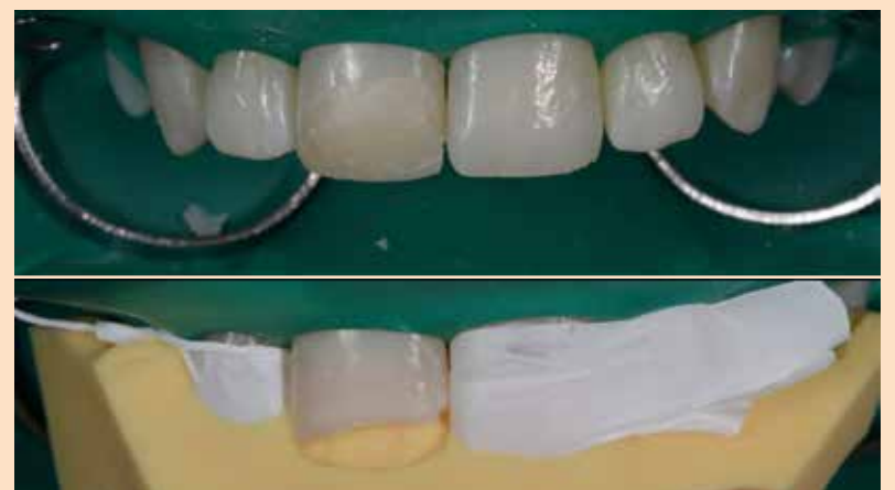
Slika 4: Tzv. direktni "mock-up" i izrada silikonskog ključa