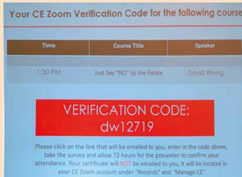
Slika 1: Primer verifikacije prisustva putem mobilne aplikacije

To znači da je svaki posetilac verifikaciju svoga prisustva mogao da izvrši putem mobilne aplikacije unoseći odgovarajući kod koji su predavači objavljivali u toku svojih predavanja (Slika 1). Ovime je, pomoću najsavremenije tehnologije, izbegnuta manipulacija sa prisustvom predavanjima, što postaje ključni problem organizatora kongresa kontinuirane medicinske edukacije na našim prostorima.