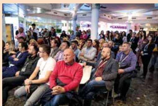
Sl. 5.: Veliko zanimanje na štandu za demonstracije uživo i kod izlagača