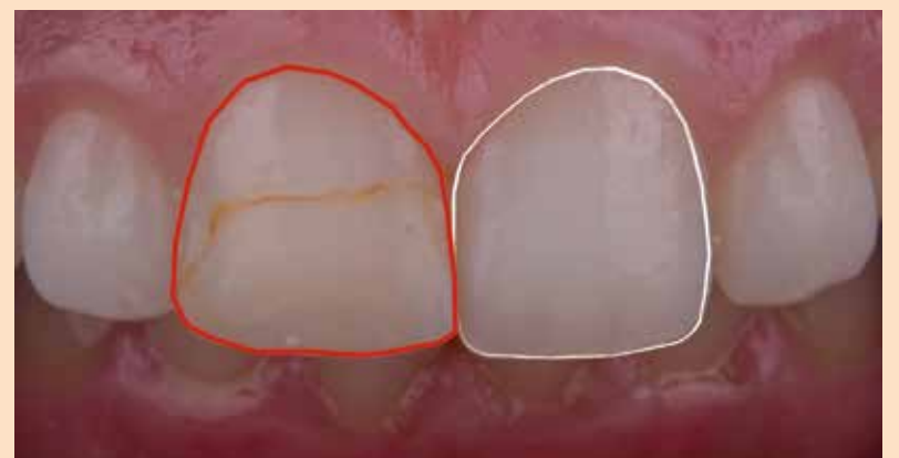
Slika 3: Analiza osobina zuba koji je potrebno restaurirati, i istoimenog zuba sa suprotne strane.

Modifikacijom prisutne kompozitne nadogradnje dobijen je željeni oblik buduće restauracije koji je artikulisan u ustima u maksimalnoj interkuspudaciji i laterotruzijskim i protruzionim kretnjama (tzv. direktni "mock-up"). Nakon toga izrađen je silikonski ključ pomoću koga se precizno prenosi palatinalna površina zuba, te naknadna artikulacija restauracije u ovoj situaciji neće biti potrebna (slika 4).