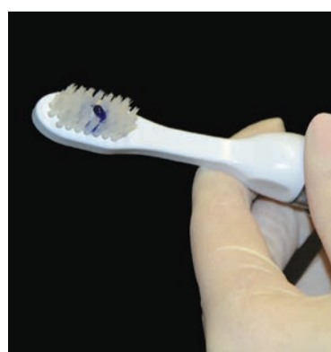
Fig. 2 - Ena White 2.0 Micrium.

l'elemento numero 11 si avvicina, per croma, tinta e valore al colore A2. A destra si riporta sulla scala di valore, croma e tinta la discrepanza fra A2 e il dente preso in considerazione: l'entità del croma è maggiore rispetto a quello dell'A2 mentre la tinta è inferiore. Ciò indica, partendo dall'A2, un colore complessivo più saturo e tendente al rosso.