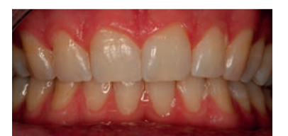
Fig. 4 - Caso clinico 1, post-sbiancamento.