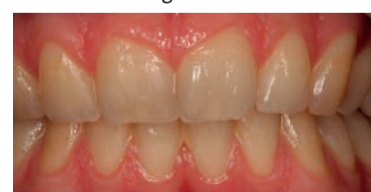
Fig. 3 - Caso clinico 1, pre-sbiancamento.