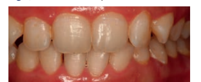
Fig. 6 - Caso clinico 2, post-sbiancamento.