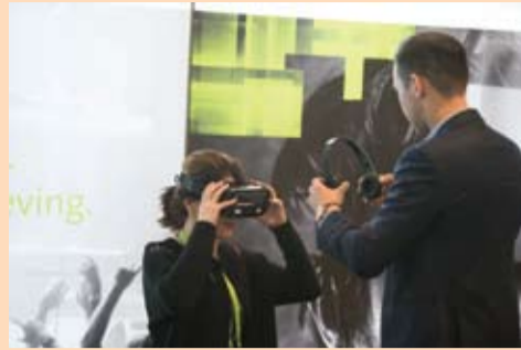
Slika 6: Učesnici su rado iskoristili priliku za razgovor s izlagačima.