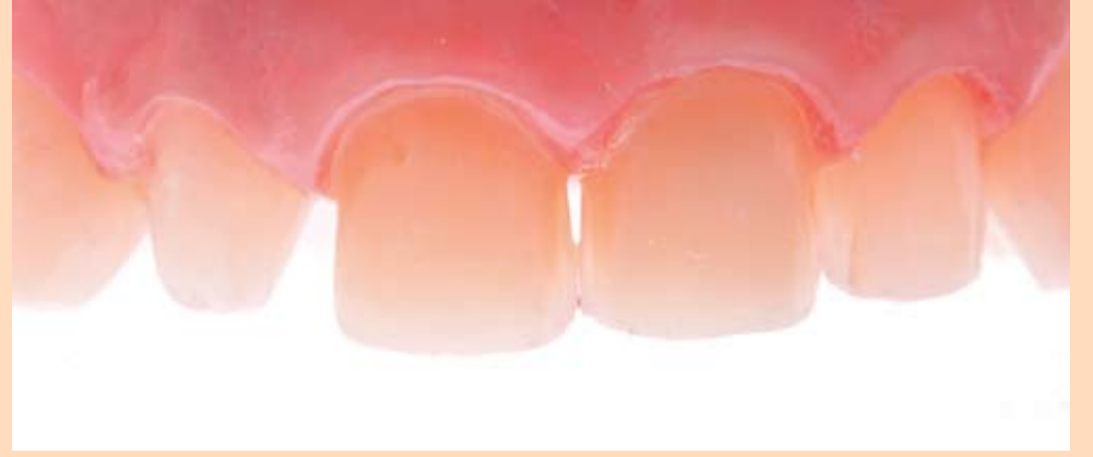
Slika 9: Prikaz preparisanih prednjih zuba

uz pomoć softvera DSD (Digital Smile Design) i vizualizacijskog softvera VisagiSMile.