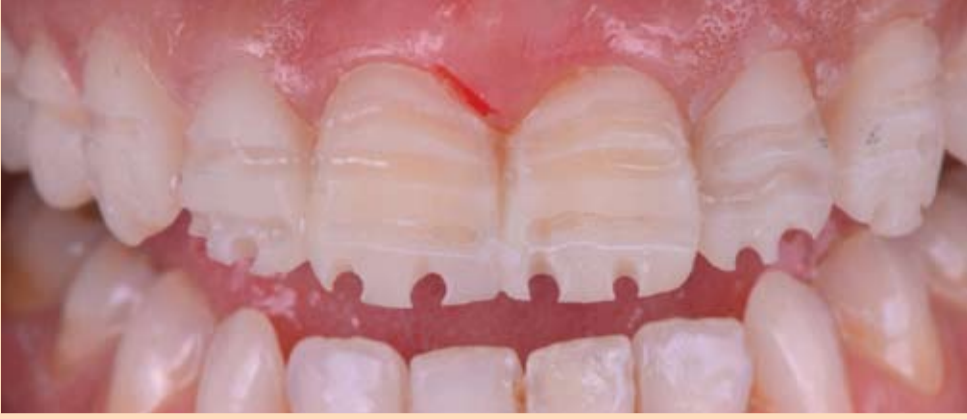
Slika 8: Ciljana preparacija zuba kroz mock-up