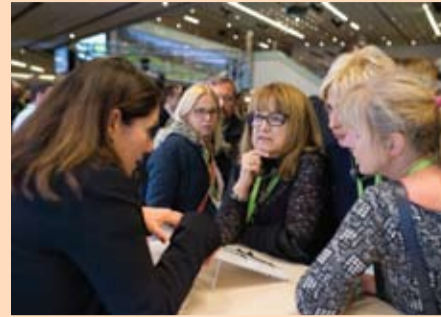
Slika 7: Opuštena atmosfera i zabava na Esthetic Partyju.

Koubi. "Počinjemo s estetskim dizajnom, a zatim proveravamo funkciju."