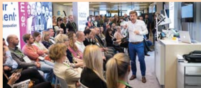
Slika 8: Veliki interes za radionice u ICDE-u i na štandu za demonstracije uživo.

Vrhunac je bilo predavanje dr. Ronalda Hirate iz Brazila koji je