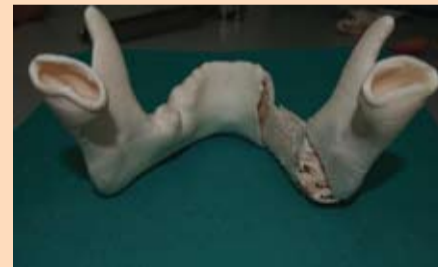
Slika 8: Levo - Biomodel donje vilice i dela ilijačne kosti koji ispunjava postresekcionni defekt. Učinjeno je poređenje simulacije transplantacije i podudarnosti koštanog transplantata. Uočava se prominencija transplantata u disto lingvalnom aspektu, koja je predviđena kompjuterskom superpozicijom.