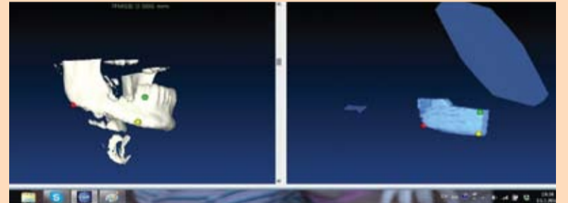
Slika 6: Kompjuterska simulacija pozicioniranja koštanog transplantata u predeo donje sa desne strane