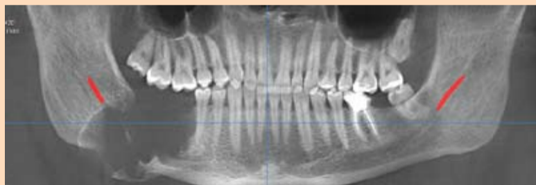
Slika 1: Preoperativni snimak

Radiološki nalaz je upućivao na multicistični tip ameloblastoma. Za ovu vrstu lezija na ortopantomografskom snimku karakteristične su mnogobrojna jasno ograničena cistična rasvetljenja koji nekada podsećaju na „engl. Soap bubbles“ (termin koji se koristi u anglosaksonskoj literaturi a bukval-