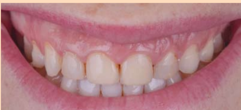
Slika 1a i 1b: Početna situacija. Diskolorisane restauracije na gornjim prednjim zubima. Pacijentkinji ne smeta asimetrična gornja usna niti vidljiva gingiva kada se smeje.

Cilj keramičkih faseta bio je povećanje volumena zuba. Zubi bi trebali da izgledaju markantnije i duže. Prilagođavanje dentalnih proporcija bilo je neophodno kako bi se stvorio skladan izgled tokom osmeha. Za izradu mock-upa korišćeni su SKYN modeli (dr. Jan Hajto "Anterior Model Set", tj. set prednjih modela) kao referenca (slika 2.). To je reprodukcija prirodnih zuba. Na zahtev pacijentkinje zubi su odabrani