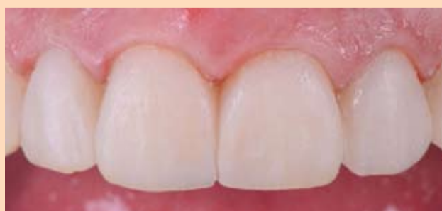
Slika 6: Gotovi mock-up. Fotografije i videozapisi koriste se za procenu.