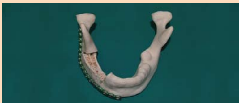
Slika 9: Korigovana nepodudarnost biomodela koštanog transplantata. Preoperativno adaptirana titanijumska ploča na biomodelu.

nom prevodu ima značenje – „Mehorovi sapunice“). Shodno protokolima lečenja, učinjena je biopsija promene u uslovima opšte anestezije. Patohistološka dijagnoza ustanovila je dijagnozu ameloblastoma. Ameloblastomi vilica se najčešće razvijaju u predelu donjeg trećeg molara (u oko 80%). Ameloblastom je benigni, spororastući, najčešći odontogeni tumor epitelnog porekla. Bez obzira na entitet, zahvaljujući biološkim osobinama ovaj tip tumora je lokalno invazivan i može recidivirati u visokom procentu ukoliko se ne tretira radikalnim pristupom. Retko (oko 1%), mogu postojati i maligne