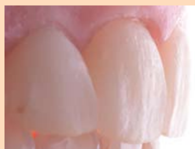
Slika 7a i 7b: Površine mock-upa lagano se obrađuju.