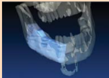
Slike 7a i 7b: Virtuelno pozicioniranje transplantata; Superpozicija koštanog transplantata i donje vilice