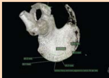
Slika 4: Kompjutersko određivanje oblika i veličine koštanog transplantata ilijačne kosti na osnovu kompjuterizovane tomografije ilijačne kosti - „davajuća“ regija