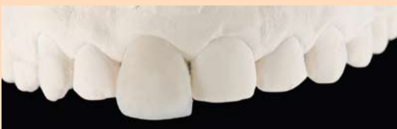
Slika 4a i 4b: Kompozitne ljuske izradene pomoću silikonskog ključa s prirodnim oblikom i površinskom teksturom na modelu.