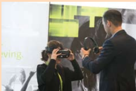
Slika 6: Učesnici su rado iskoristili priliku za razgovor s izlagачima.