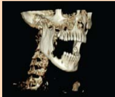
Slika 3: Predeo osteolitičnog procesa donje vilice sa desne strane - ameloblastoma