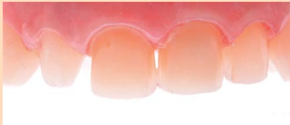
Slika 9: Prikaz preparisanih prednjih zuba

uz pomoć softvera DSD (Digital Smile Design) i vizualizacijskog softvera VisagiSMile.