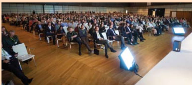
Slika 4: Oko 1.400 učesnika pratilo je prezentacije o najnovijim trendovima u stomatologiji i zubnoj tehnici

i sistema za obradu fotografija. Sascha Hein to je pokazao svojim sistemom za određivanje boje koji se temelji na luminescenciji i komponentama boje, a ne na digitalnim ključevima boja. "Ako radite s udaljenim la-