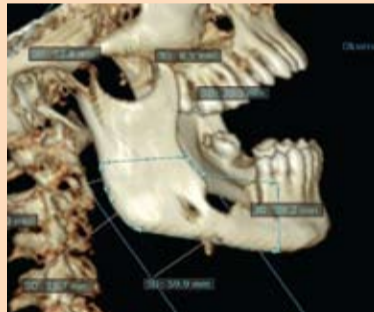
Slika 2: Planiranje resekcije donje vilice sa desne strane-obeleženo u mm