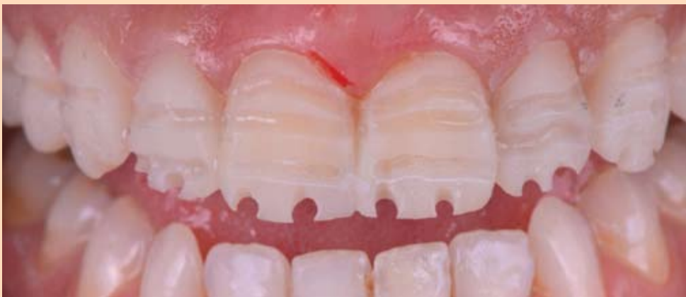
Slika 8: Ciljana preparacija zuba kroz mock-up