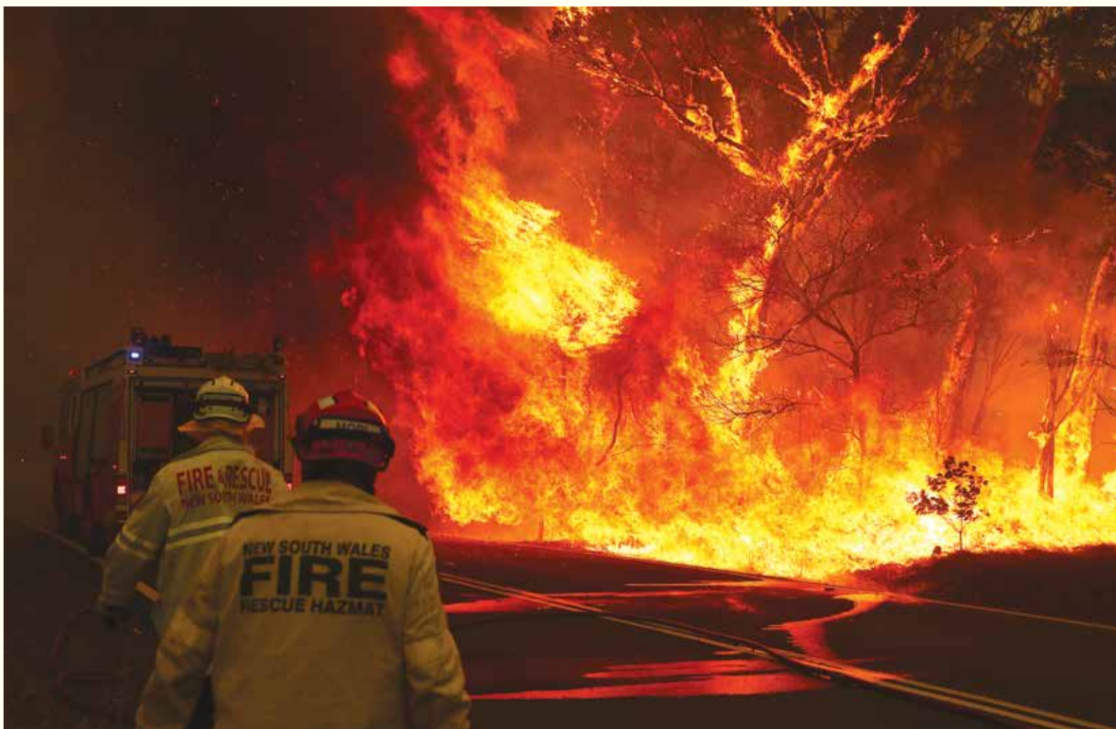
U periodu od nekoliko proteklih mjeseci, stotine požara su uništile australijsku divljinu. Lokalni i međunarodni članovi dentalnih zajednica su istupili kako bi pružili podršku onima koji su zahvaćeni ovom prirodnom nepogodom.

„Zaista je jako tužna činjenica koliko života se okrenulo u sunovrat,“ rekao je dr. Daniel Chin iz stomatološke ordinacije Balhannah za Dental Tribune International. „Samo se nadamo da će