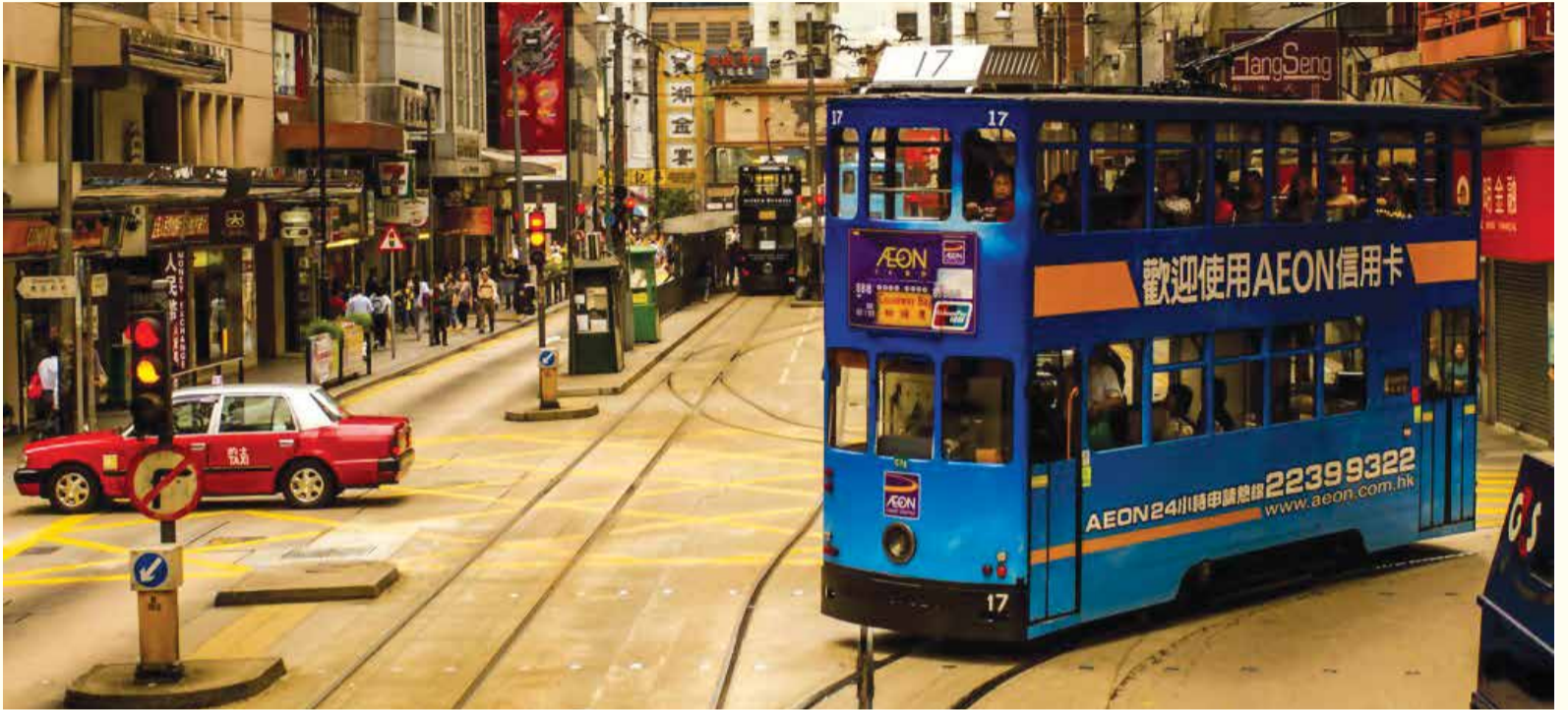
SmileDirectClub je dodao Kowloon