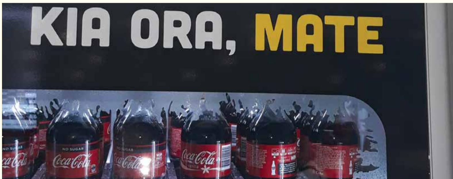
Marketinški trik Coca-Cole, kroz kulturološko prisvajanje te reo Maori (Maori jezika), targetira Novozelance koji su izloženi riziku.

„Ova korporacija koja apsolutno ne brine za našu mokolupna (djecu), našu kuia (nenu) i kaumatua (starije) je uze-