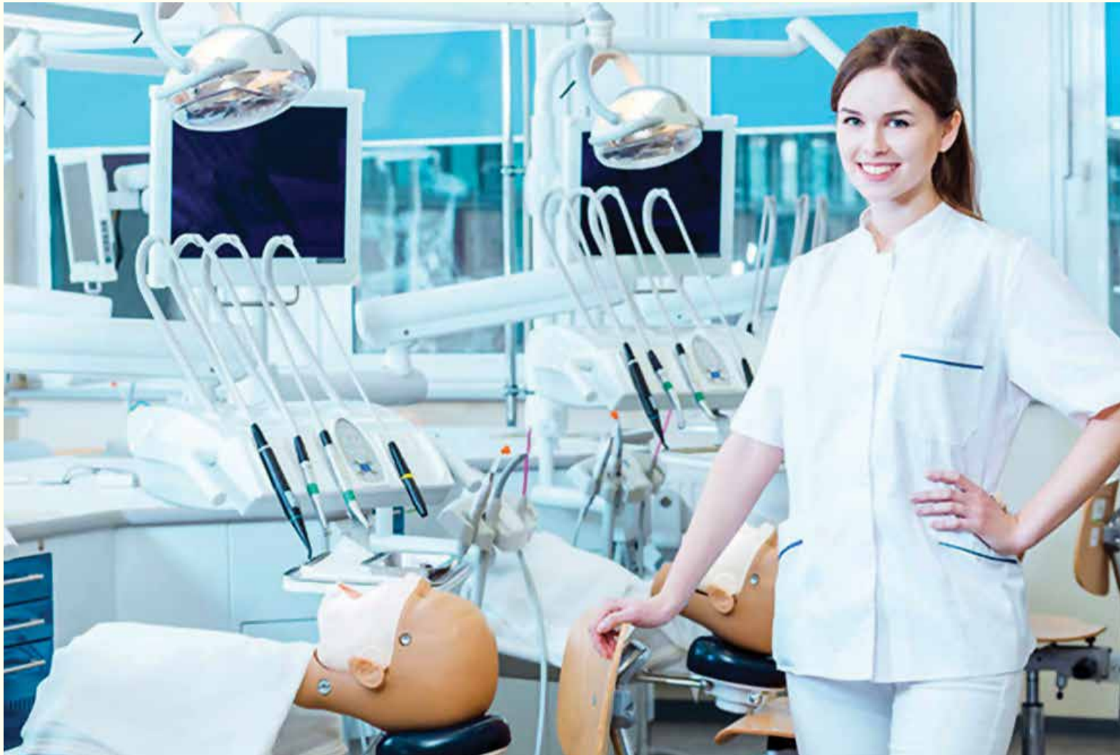
Kako se stomatološka industrija konstantno širi, tako se i povećava broj opcija za karijeru.

SIDNEJ, Australija: Najčešće se slike u vezi sa stomatologijom svode na stolicu u jednoj prostoriji, jaka svjetla i dva ili tri para očiju koje bulje u usta pacijenta. Međutim, kako se industrija razvija tako raste i broj opcija za karijeru. Nedavno objavljen članak sa Sidnej univerziteta govori o osoblju i alumnistima koji su izgradili interesantne karijere van kliničkog okruženja.