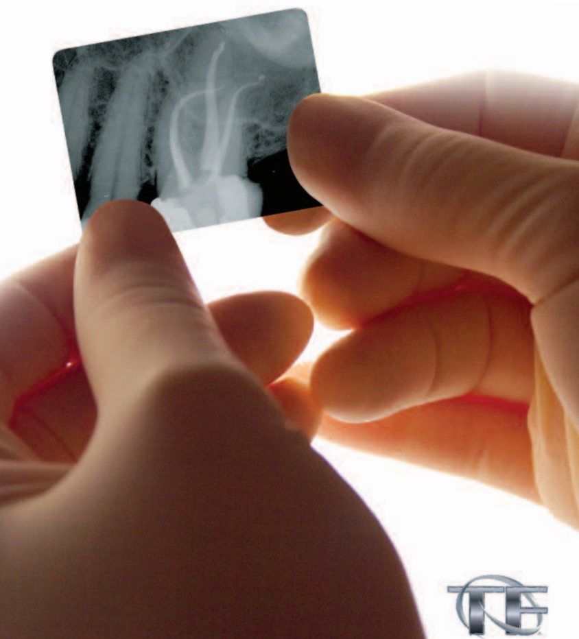
Radiograph courtesy of Dr. Christophe DEROOSE.