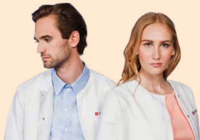
Новата модна марка CROIXTURE представи последните тенденции в клиничното облекло в Истанбул.

Адресът на българската платформа за дентално онлайн обучение, разработвана от Dental Tribune Bulgaria, е www.dtstudyclub.bg. DTI