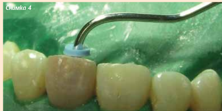
Снимки 3, 4 Зъб 21 – озониране за 24 сек на канала с апарат за озонотерапия Prozone (W&H) и изграждане на апикална бариера от МТА.