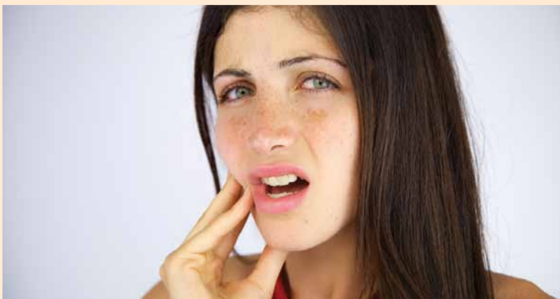
Най-често срещаната причина за лицева болка след заболяванията на зъбите е т.нар. темпоромандибуларен миофасциален дисфункционален болков синдром, който води до хронична болка и дисфункция на темпоромандибуларната става.

Проучването е озаглавено „Естрогенът утежнява йодоацетат-индуцирания остеоартрит на темпоромандибуларната става“ и е публикувано в предпечатното онлайн издание на Journal of Dental Research на 9 август. DT