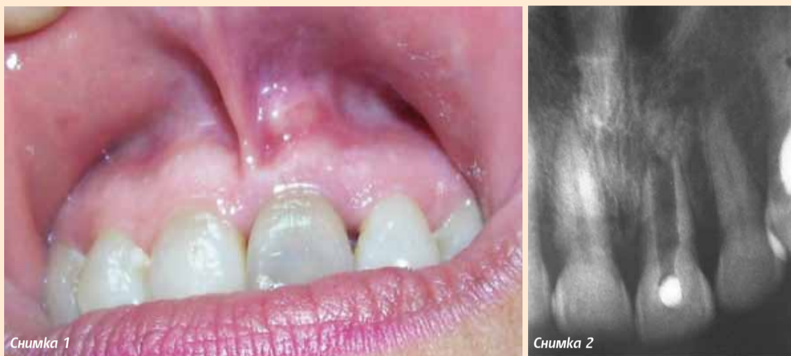
Снимка 1 Зъб 21 – клиничен вид на периапикалните меки тъкани с наличие на фистула над зъб 21.

ДОЦ. ГЕОРГИ ТОМОВ, ДОЦ. ЕЛКА ПОПОВА, ФДМ-ПЛОВДИВ