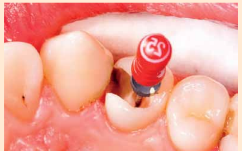
Ендодонтското лечение е необходимо тогава, когато пулпата вътре в кореновия канал се възпали или инфектира.

С поред доклад, публикуван в онлайн изданието на „Сиатъл Таймс“, щатски съд присъжда 35 милиона долара на 29 бивши пациенти на пенсиониран зъболекар, за когото се твърди, че е извършвал ненужно ендодонтско лечение в период от почти 30 години. Случаят е едно от най-големите искания за компенсация поради дентално нехайство.