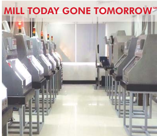
State-of-the-Art Fully Integrated Digital Lab