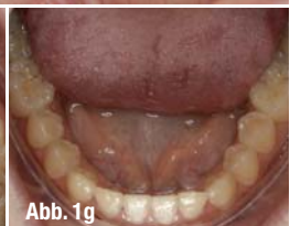
Abb. 1a–g_Darstellung der Patientin zu Beginn der Behandlung. Auf den Abbildungen ist das Ausmaß der Progenie deutlich erkennbar.

_Progene Behandlungsfälle mit deutlichen ästhetischen Einschränkungen stellen die Zahnärzte in der Regel vor eine große Herausforderung. In der Vergangenheit – damit ist die in Deutschland klassisch aufgeteilte zahnmedizinische Struktur von Fachzahnärzten und Zahnärzten gemeint – erfolgte in solchen Fällen die Überweisung zu einem Kieferorthopäden, der in Absprache mit dem Zahnarzt versuchte, den Fall funktionell und ästhetisch adäquat zu lösen. Heute hat der Zahnarzt zahlreiche Möglichkeiten (Curricula, Masterstudiengänge etc.), um sich auch in speziellen Bereichen der Zahnmedizin als Generalist hoch qualifiziert weiterzubilden, bis er in der Lage ist, komplexe Fälle aus einer Hand behandeln zu können. Diese moderne Entwicklung ermöglicht es den Patienten, eine Betrachtung des Zahnes, des Mundraums und des Menschen zu erhalten – ohne dass der Behandler fachlich auf ein spezielles Problem fixiert ist. Dies ist insbesondere bei hochästhetischen Fällen von großer Bedeutung, denn die Zerstückelung der Zahnmedizin auf mehrere Behandler und deren unterschiedliche Behandlungskonzepte kann zu Differenzen führen, die sich