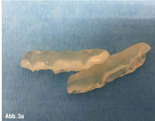
Abb. 3a und b _Darstellung der Aufbisse und der Osteosyntheseplatten. Unverkennbar ist, wie schwierig der Weg für den Patienten bis zur Operation sein muss.