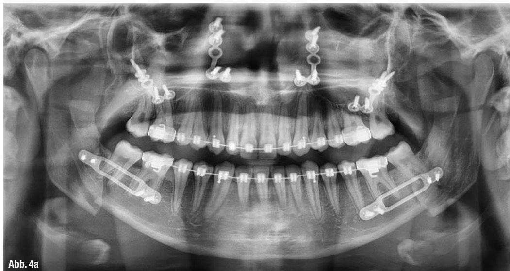
Abb. 4a und b _OPG postoperativ und ein Jahr nach dem operativen Eingriff.

Eine kombinierte zahnärztlich-chirurgische Therapie erfordert nicht nur eine enge und zielgerichtete Zusammenarbeit mit einem Mund-Kiefer-Gesichtschirurgen, sondern auch eine absolute Akzeptanz des Therapieplans durch den Patienten und gegebenenfalls durch die Eltern. Die Behandlung ist langwierig