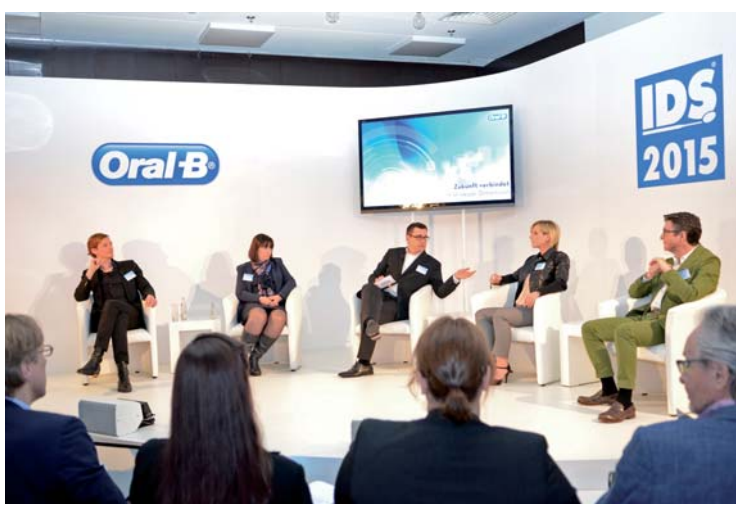
* Oral-B Live-Talk. * Oral-B Live Talk

What will biofilm management look like in the future, and what sort of aids might help make it possible for patients to enjoy improved oral hygiene? This