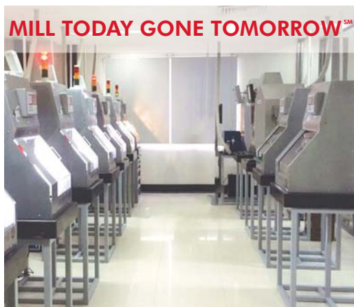
State-of-the-Art Fully Integrated Digital Lab