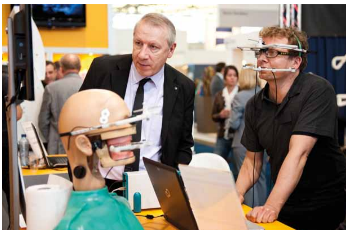
Dental Expo is ook in 2014 dé showroom van de mondzorg.