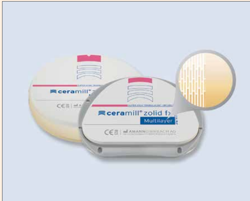
El material Ceramill Zolid FX Multilayer con gradientes de color y translucidez.

Para una elevada seguridad de color, el sistema Ceramill CAD/