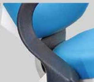
ARTICULACIÓN CENTRAL ÚNICA