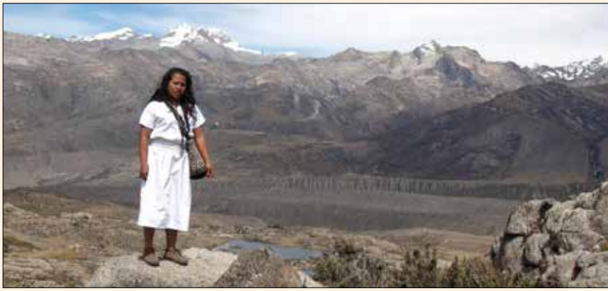
Un fotograma del documental «Ati y Mindhiwa» con una de las protagonistas en la Sierra Nevada.