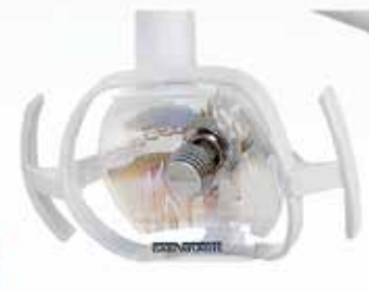
REFLECTOR REFLEX LD CON LÁMPARA HALÓGENA O LED

Para más informaciones y presupuesto: LUCIA.BERNARDI@DABIATLANTE.COM.BR