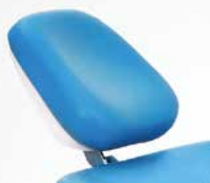
RESPALDO DE CABEZA MULTIARTICULADO