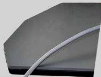
BASE EN ACERO