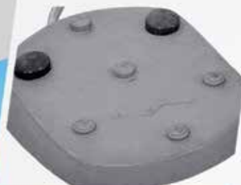
PEDAL DE COMANDO con vuelta a cero, tres posiciones de trabajo y control de intensidad del reflector.