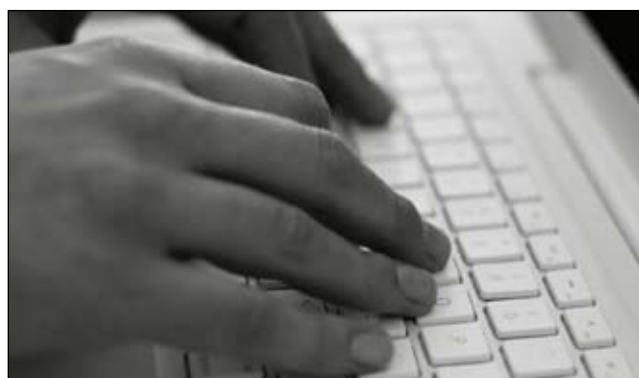
Μία εθνική έρευνα από τη Sesame Communications βρήκε ότι οι ορθοδοντικοί ασθενείς προτιμούν τις υπενθυμίσεις με γραπτά μηνύματα και email σε σχέση με τις τηλεφωνικές υπενθυμίσεις σε αναλογία τέσσερα προς ένα.

Αντιπρόεδρος στρατηγικής προϊόντων στη Sesame Communications. Ως πρώην ιδιοκτήτης επιχείρησης, καταλαβαίνει τις δυσκολίες που αντιμετωπίζει το οδοντιατρείο και το ορθοδοντικό ιατρείο στη σημερινή αγορά. Είναι κάτοχος μεταπτυχιακού τίτλου στο μάρκετινγκ εφαρμοσμένης πληροφορικής και πτυχίου ψυχολογίας από το Πανεπιστήμιο Στάνφορντ.