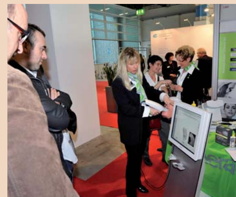
Aktuell von der IDS in die Schweiz gebracht: Cara Trios, der neue Intraoralscanner von Heraeus, stiess auf grosses Interesse.