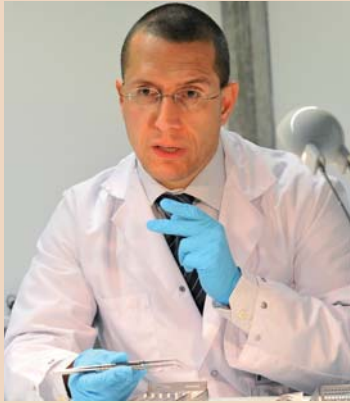
Auf die präzise Nahttechnik kommt es an, Prof. Sculean erklärt wie.

cherentwöhnung oder der Verbesserung der Mundhygiene. Die Mitarbeit des Patienten betreffend Hygiene und Einhalten des Recallintervalles, welches durch die „Berner Spinne“ bestimmt wird, sind die Erfolgsfaktoren für die Erhaltung einer erfolgreichen Parodontaltherapie.