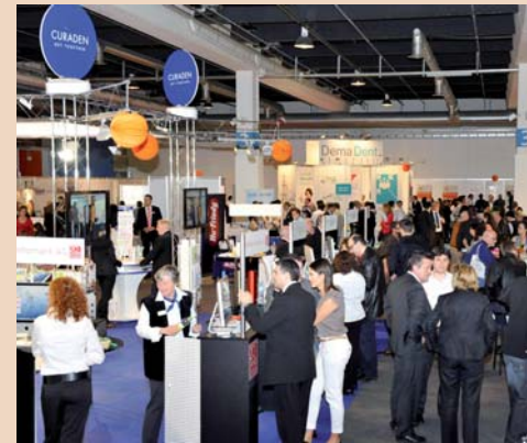
Zahlreiche Besucher an der zweiten Fachdental in Zürich. Im Vordergrund der Stand der Curaden-Gruppe und Healthco Breitschmid.