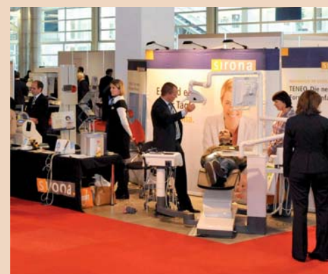
Mit den-IDS Neuheiten angetreten: Sirona verbuchte gute Umsätze.