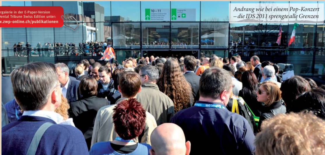
Andrang wie bei einem Pop-Konzert – die IDS 2011 sprengte alle Grenzen

Weitere Informationen auf www.zwp-online.ch