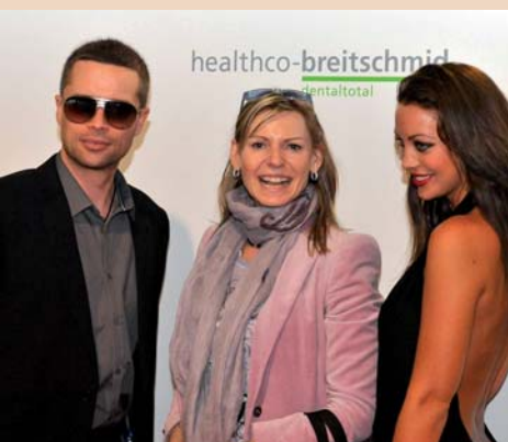
Ein bisschen Glamour muss sein. Für Fan-Fotos posierten „Angelina Jolie und Brad Pitt“.