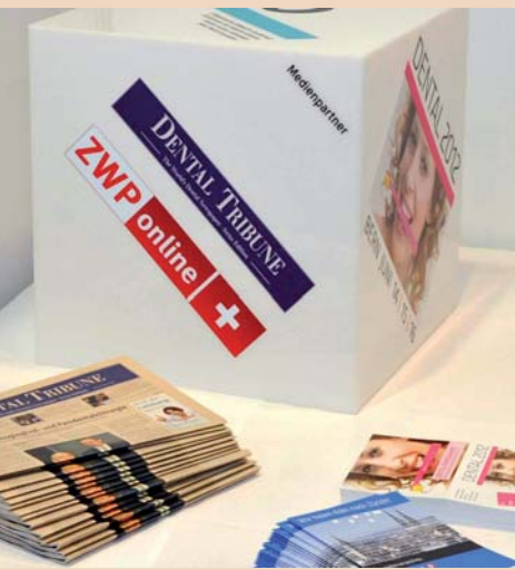
Die Medienpartnerschaft der Dental 2012 mit Dental Tribune und zwp-online wurde gestartet.