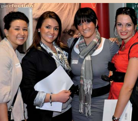
Ein ganzes Praxisteam besuchte die Fachdental. Ihnen scheint die Ausstellung zu gefallen.