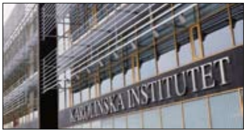
根据2015年QS世界大学学科排行榜，瑞典卡罗琳学院的牙医学科排名全球第一位。

陈总经理：作为带领定远的一个大家长，我是觉得蛮骄傲的。20年来，从定远走出去的员工超过2万人，大多数还在从事牙科科技这个行业，有的甚至自己创业做了老板！他们有了这个技术或者事业，在生活上基本上都可以养活自己、养活家庭，甚至可照顾更多的人，他们对社会都做出了或多或少的贡献，这算是定远对整个社会尽了些责任，这是我感到骄傲的另一件事！再一个就是，牙科科技行业还是一个以技术为前提的良心事业，技术、质量是1，管理啊营销啊宣传啊都是多个0，没有1这个前提再多的0都是无效的。所以希望未来的中国牙科科技能够踏实的以技术、品质为基础，抱着永续经营的理念走向未来，走向全世界！就像定远的企业理念一样——让全世界的人都拥有好牙！