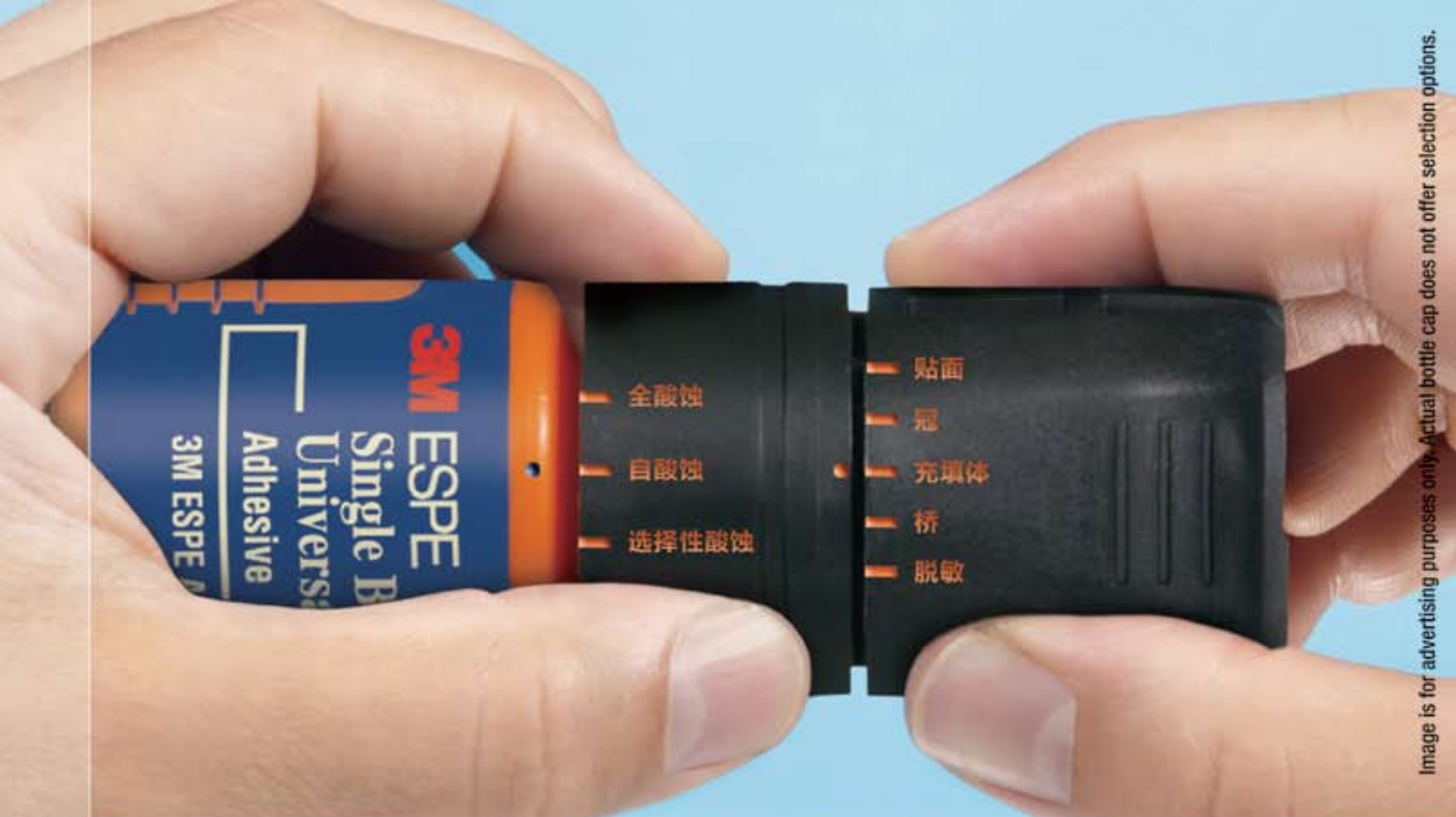
Image is for advertising purposes only. Actual bottle cap does not offer selection options.