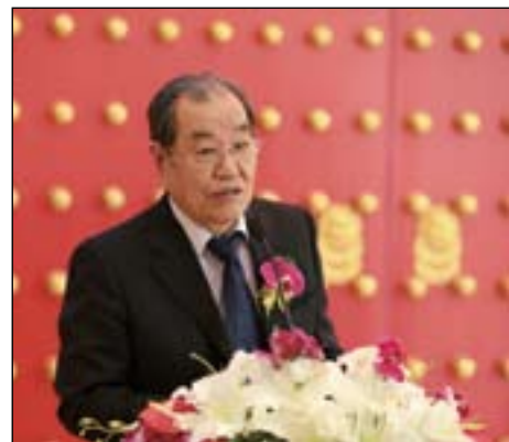
王会长致辞讲话内容摘录

尊敬的各位领导、各位嘉宾、各位同道,大家上午好!非常荣幸来参加山东沪鸽口腔中小企业股份转让系统的挂牌仪式,第一次参加这样的仪式,心情很激动。这是因为这是我国民族口腔产业系统的第一家。中小企业股份转让,又叫做新三板的上市,当然是一个非常重要的机遇和平台,对山东沪鸽口腔来说是这样,对中国的口腔民族产业来说也是如此。大家都知道,在我们国家,尽管这么些年,我们看到口腔医学事业发展的红红火火,口腔医疗资源增加的很快,我们每年新增加的口腔医生就有24000多人,相当于1978年以前30年总和的4倍还要多,遍布全国各地的口腔医疗机构,应该说为整个中国口腔带来了巨大的市场需求,我们也看到了世界的各地名牌的口腔产品,包括设备、器械、材料,都纷纷进入中国,而且把中国看做除美国之外,这个地球上第二大的市场。但是我们也看到,我们和周边国家、和发达国家尚有巨大的差距,这个差距很多体现在以下几个方面: