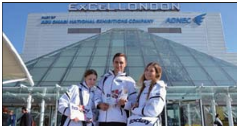
届时，世界牙科论坛 (DTI) 将在伦敦会展中心 (ExCeL) 入场口向广大与会人士免费发放大会会报。

■ 欧洲牙周病学大会 (EuroPerio) 已成为全球牙周病学与种植学领域的重要会议。日前，世界牙科论坛 (DTI) 与大会