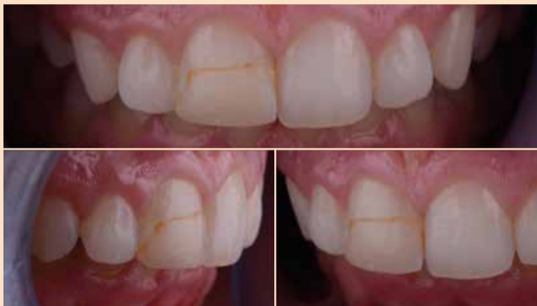
Slika 2: Početna situacija-intraoralna fotografija

Analiza i određivanje boje izvršeno je pomoću fotografije sa polarizacionim filterom i originalnog ključa boja kompozita koji je korišćen za restauraciju, Charisma Opal (slika 5).