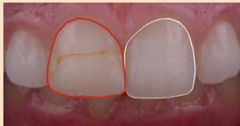
Slika 3: Analiza osobina zuba koji je potrebno restaurirati, i istoimenog zuba sa suprotne strane.

Modifikacijom prisutne kompozitne nadogradnje dobijen je željeni oblik buduće restauracije koji je artikulisan u ustima u maksimalnoj interkuspidaciji i laterotruzijskim i protruzionim kretnjama (tzv. direktni "mock-up"). Nakon toga izrađen je silikonski ključ pomoću koga se precizno prenosi palatinalna površina zuba, te naknadna artikulacija restauracije u ovoj situaciji neće biti potrebna (slika 4).