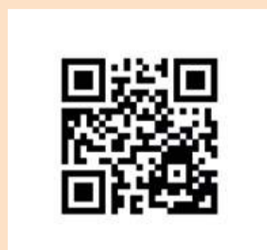
Slika 5: QR kod za mobilnu aplikaciju putem koje možete besplatno pogledati neka od predavanja

Predavanja su se odvijala u glavnoj Sali, a pored nje bilo je još 3 manje sale u kojima su održavane radionice.