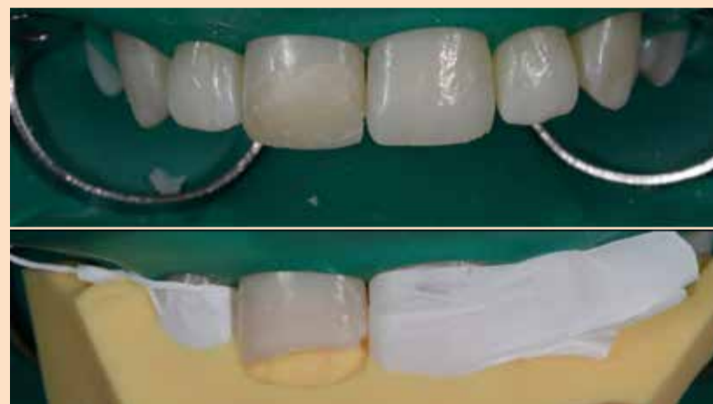
Slika 4: Tzv. direktni "mock-up" i izrada silikonskog ključa