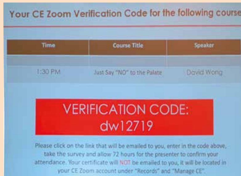
Slika 1: Primer verifikacije prisustva putem mobilne aplikacije

To znači da je svaki posetilac verifikaciju svoga prisustva mogao da izvrši putem mobilne aplikacije unoseći odgovarajući kod koji su predavači objavljivali u toku svojih predavanja (Slika 1). Ovime je, pomoću najsavremenije tehnologije, izbegnuta manipulacija sa prisustvom predavanjima, što postaje ključni problem organizatora kongresa kontinuirane medicinske edukacije na našim prostorima.