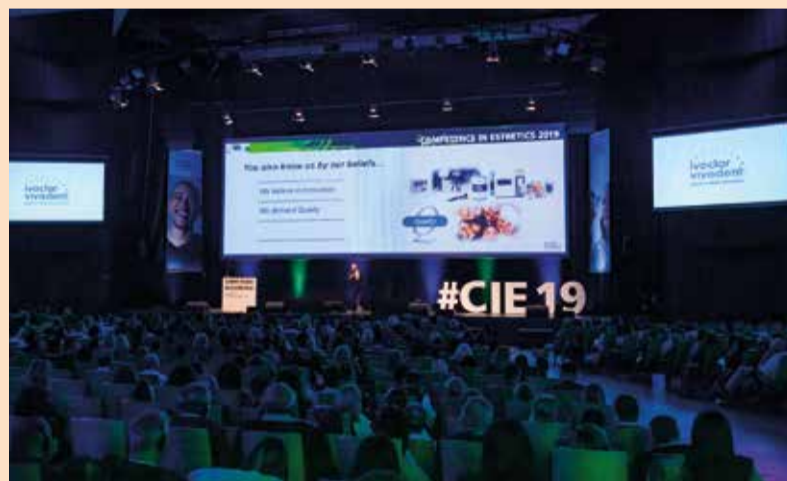
Sl. 3.: Simpozijum Competence in Esthetics, vrhunski događaj za doktore dentalne medicine i dentalne tehničare u regiji

su rada. Pokazalo se da je uska saradnja između doktora dentalne medicine i dentalnog tehničara ključ uspeha u svim slučajevima. Ostale teme o kojima se razgovaralo bile