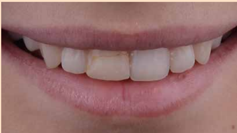
Slika 1: Početna situacija-ekstraoralna fotografija