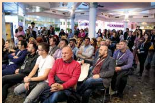
Sl. 5.: Veliko zanimanje na štandu za demonstracije uživo i kod izlagača