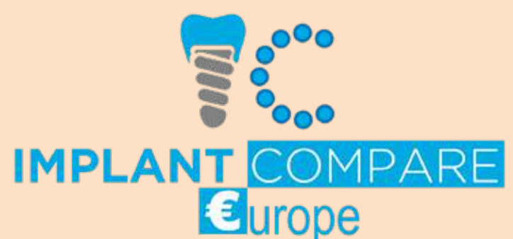
Slika 6: Zahvaljujući platformi Implant Compare, sva predavanja sa DIA 2.0 su bila prenošena uživo širom sveta

stvenih mreža i povezivanja. Naime, na DIA 2.0 svoj identit je otkrio