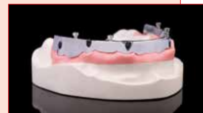
Fig. 2 - La barra in titanio è avvitata agli impianti e, a sua volta, la struttura secondaria è avvitata alla barra, consentendo di evitare canali vestibolari antiestetici nella regione anteriore e di migliorare la cura e l'igiene postoperatoria.