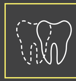
Possibilidade de simulação