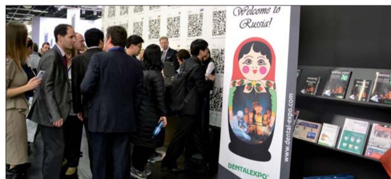
• Дентал Трибьюн и ДЕНТАЛЭКСПО являются партнерами уже много лет.

пути для новых идей и сотрудничества. Дентал Трибьюн и ДЕНТАЛЭКСПО являются партнерами уже много лет, и Русский Вечер в Кельне является лишь одним из множества совместных проектов двух компаний. «