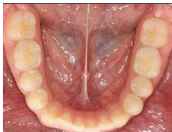
Figura 38. Arcada cuadrada.