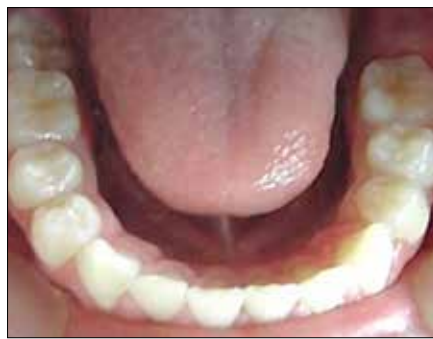
Figura 29. Armonía Lingual y de la arcada inferior.