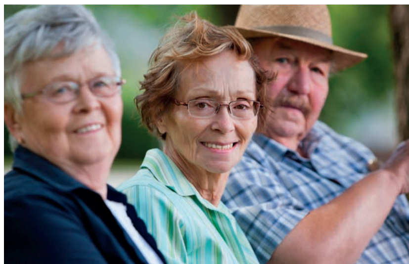
Oggi un gran numero di anziani in Australia ha bisogno di prestazioni odontoiatriche sui propri denti naturali (Photo: ©Tyler Olsen/Shutterstock).

Hanno interessato l'industria del dentale australiana anche gli interventi della politica. Iniziative come il Medicare Chronic Disease Dental Scheme e il Medicare