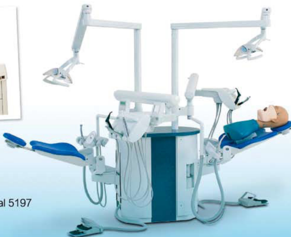
KaVo DSEclinical 5197