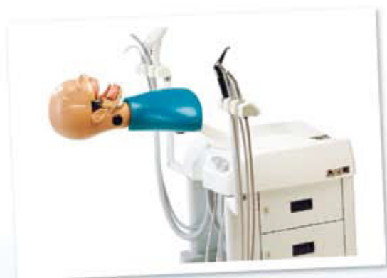
KaVo DSEplus 5192

该头模系统功能紧凑，充分利用空间，通过模块化的设计，提供专门适合客户的型号。完善的人体工程学设计能够准确模仿未来疾病的发生过程，完美的卡瓦技术为您提供完善的服务。