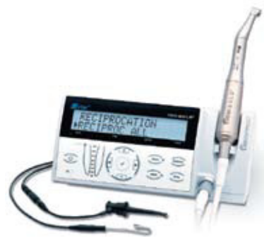
VDW齿科, 德国 www.reciproc.com www.vdw-dental.com P38展台

ANA设置用来帮助临床医生预备各种复杂根管。临床医生最多可以自行存储15个单独的扭矩和转速设置，新的镍钛根管系统的参数也可以通过Dr's Choice模式进行存储。对于传统的G钻，此马达也可以对其使用参数进行设置。