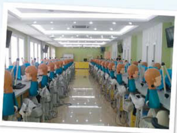
广州中山医科大学的卡瓦哥们

KaVo牙科教学仿真头模用于在大学内对牙科学生进行培训，及对高级牙医进行培训。既可以模仿患者，还可以模仿一流的、符合人体工程学的牙科治疗系统，能够使学员对实习的医疗环境和牙科环境尽早适应。