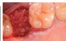
Das eingebrachte Knochenersatzmaterial