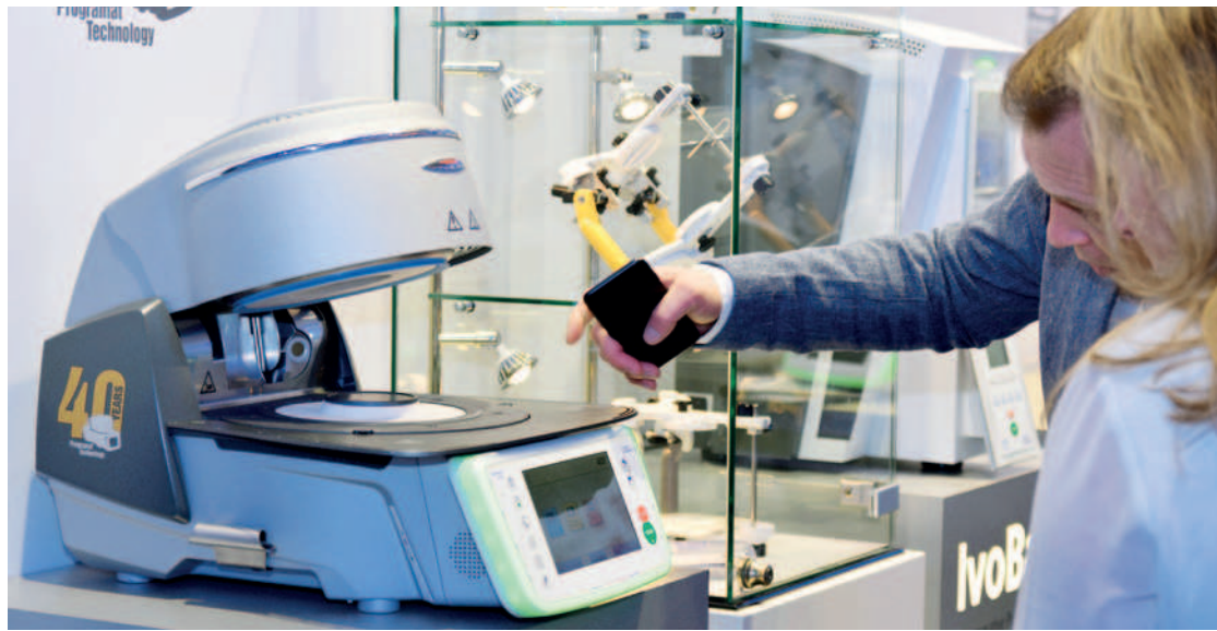
• Großes Interesse an den Exponaten von Ivoclar Vivadent bei den Besuchern.

Das beginnt mit der digitalen Abformung. Eine ganze Reihe neuer Intraoralscanner bereicherten auf der IDS das bestehende Angebot. Manche lassen sich einfach von einem Behandlungszimmer ins nächste mitnehmen, fast so komfortabel und unauffällig wie ein Kugelschreiber in der Kitteltasche. Die Anbindung ans Tablet erleichtert darüber hinaus die Patientenkommunikation. Andere Intraoralscanner sind für hohen Patientenkomfort