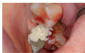
Einbringen des gewonnenen Augmentats