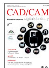
Immagine di copertina cortesemente concessa da cmf marelli srl, www.cmf.it