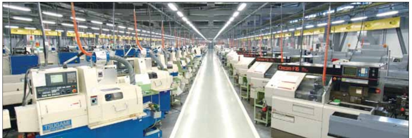
· NSK fabrique toujours la majorité des pièces de précision à l'interne. · NSK still manufactures most of the precision parts in-house.