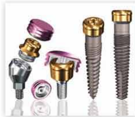
Piliers GPS et implants GoDirect GPS Overdenture Attachment System and GoDirect Implants