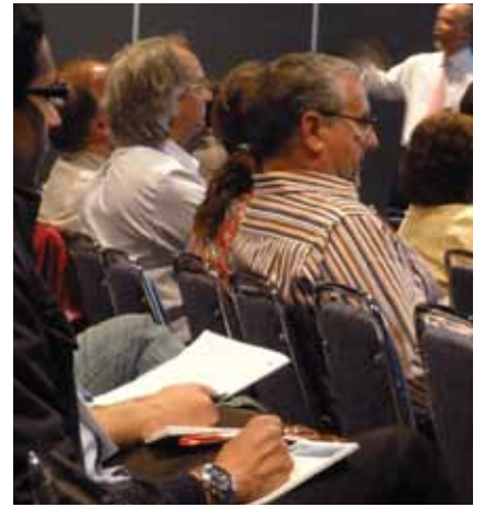
• La 43 e édition des JDIQ fournit un large éventail d'offres riches en enseignement. (Photo/Robert Selleck, DTI) • This 43rd edition of the JDIQ serves up a broad selection of educational offerings. (Photo/Robert Selleck, DTI)

La balance des autres participants s'identifie aux différents termes utilisés ci-haut.