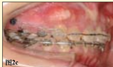
图2a-2e: 正畸治疗关闭间隙后。