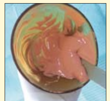
图5: 调拌海琴藻酸盐印模材。