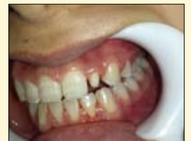
图2: 临床牙体预备后基牙照片。