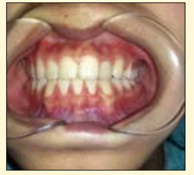
图8: 修复体戴入口内。