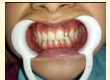
图1: 修复前口腔情况。