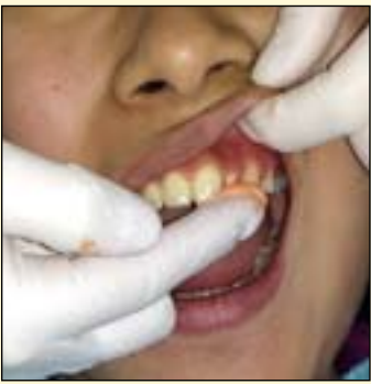
图6: 模型制取: 用手指挑少量藻酸盐压入工作区基牙牙龈沟处。